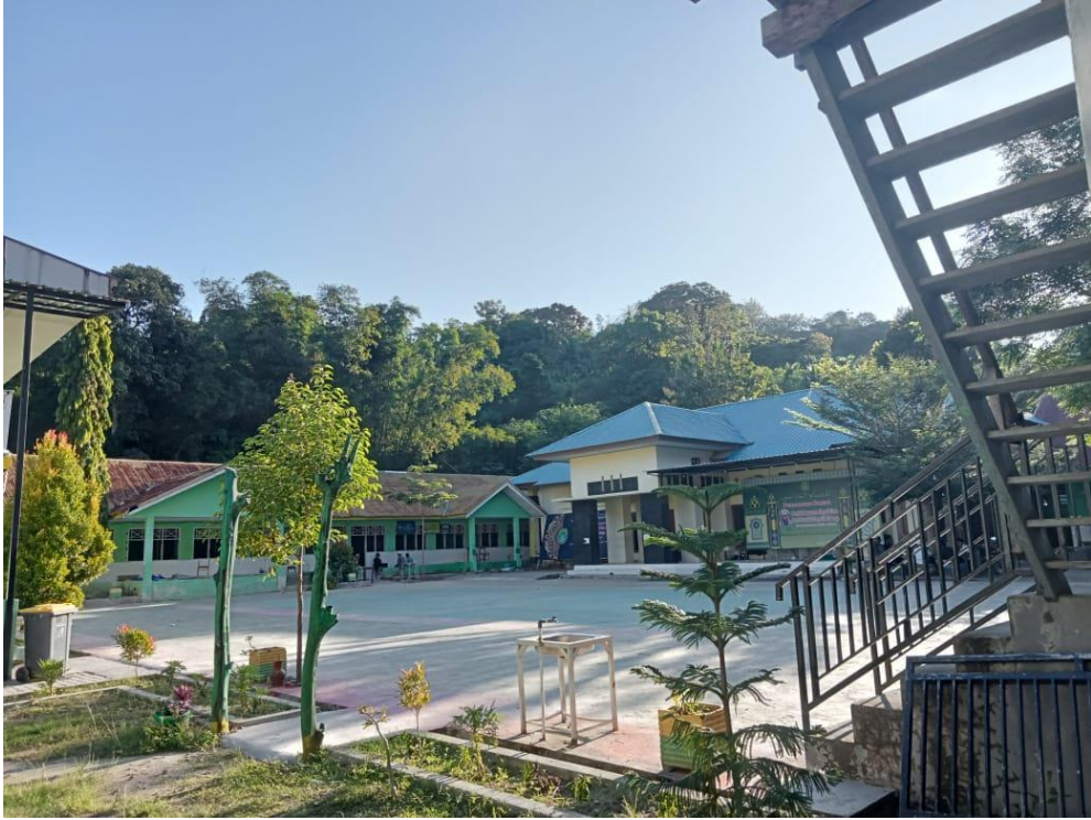
(lingkungan MA Pondok Pesantren Baruga).