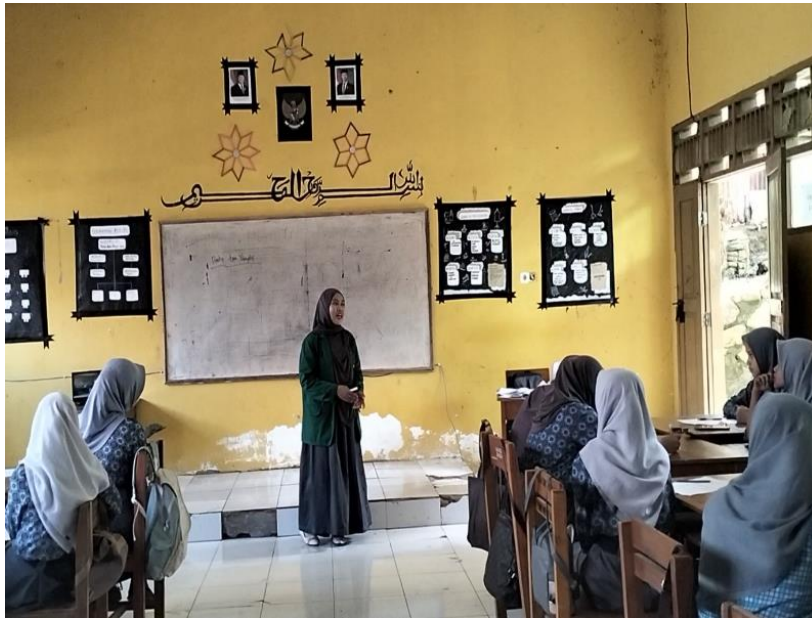
Gambar 4: Post-Test Dokumentasi post-test Motivasi Belajar Peserta Didik Kelas XI DPB 2 Senin, 21 Juli 2025