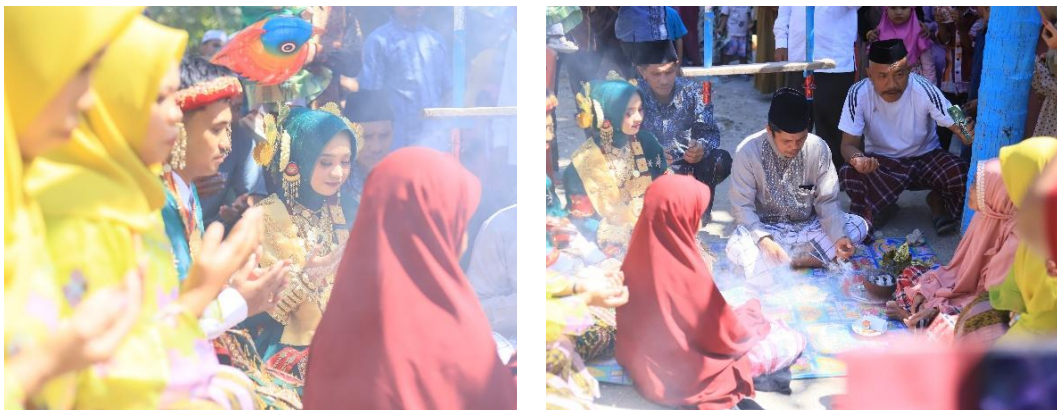
Gambar 2. Mambaca-baca (Doa Bersama)

Orang tua dan pengantin akan melakukan Mambaca-baca (Doa Bersama) yang dipimpin oleh orang tua pengantin. Doa di tujukan kepada Allah SWT, biasanya doa dimulai dengan mendoakan orang tua terdahulu yang telah mendahului, kemudian keberkahan makanan yang di nampan, kebahagiaan dan kebaikan pengantin setelah menikah, dan keselamatan pengantin ketika menaiki ayunan agar tidak terjadi hal yang tidak inginkan.