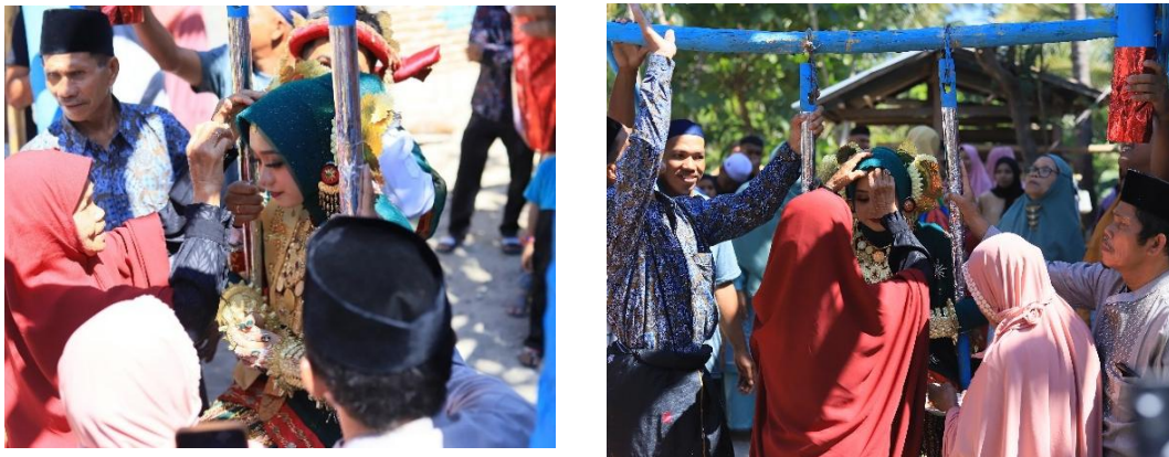
Gambar 3. Prosesi Macciqbo (Menempelkan perhiasan pada dahi pengantin perempuan)

Sebelum ayunan diputar, orang tua pengantin akan membawa Kappar bulawang (Nampan Tempat Emas) dan pengantin Perempuan akan Dici'boq . Pertama, orang tua mempelai yang menikah akan menempelkan Bulawang (Emas berbentuk koin) atau satu emas cincin di tempelkan pada dahi pengantin perempuan. Tidak ada persyaratan mutlak mana yang digunakan, tergantung dari kesiapan keluarga pengantin.