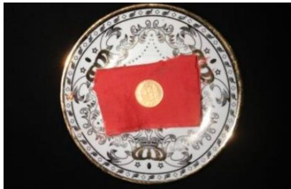
Gambar 4. Bulawang (Emas berbentuk koin)