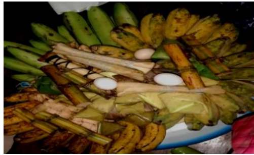
Gambar 1. Kappar Baca-baca (Nampan Do'a)

Dari keterangan di atas bahwa makanan yang berada di nampan berupa dan buah-buahan seperti Loka (Pisang), Cucur (Makanan dari dari tepung beras dan gula aren), Atupeq (Ketupat), Talloq (Telur), Pambe (Tebu), Buqu-buqus (Makanan dari tepung ketan, ubi dan santan).