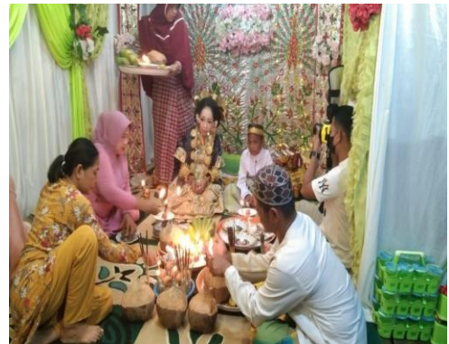
Tahap Pelaksanaan Ritual