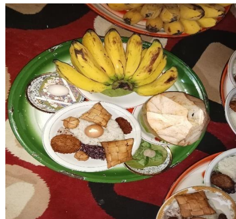
penampan pande sasi'