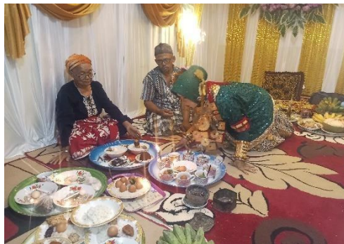
Ritual Peniupan Palla-Pallang.