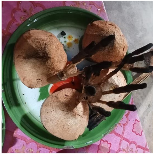
Anjoro' (Kelapa 4 Buah)