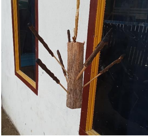
Palla-Pallang (Lilin Tradisional)