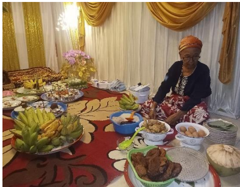
Tahap Persiapan Ritual