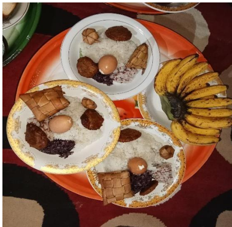
Sokkol (Nasi Ketang)