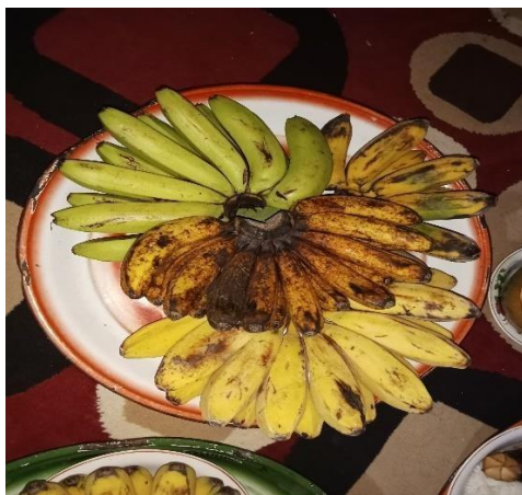
Loka Tallu' Rupa (Pisang 3 Jenis)