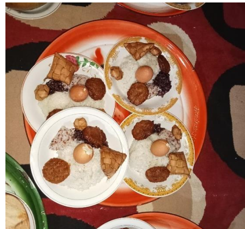
Sokkol (nasi ketang)