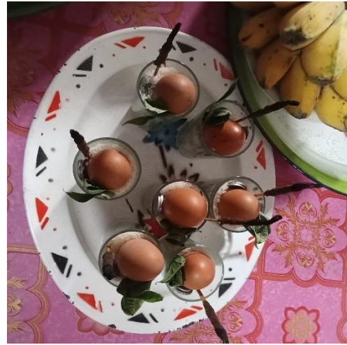
Tallo' Manu (Telur Ayam)