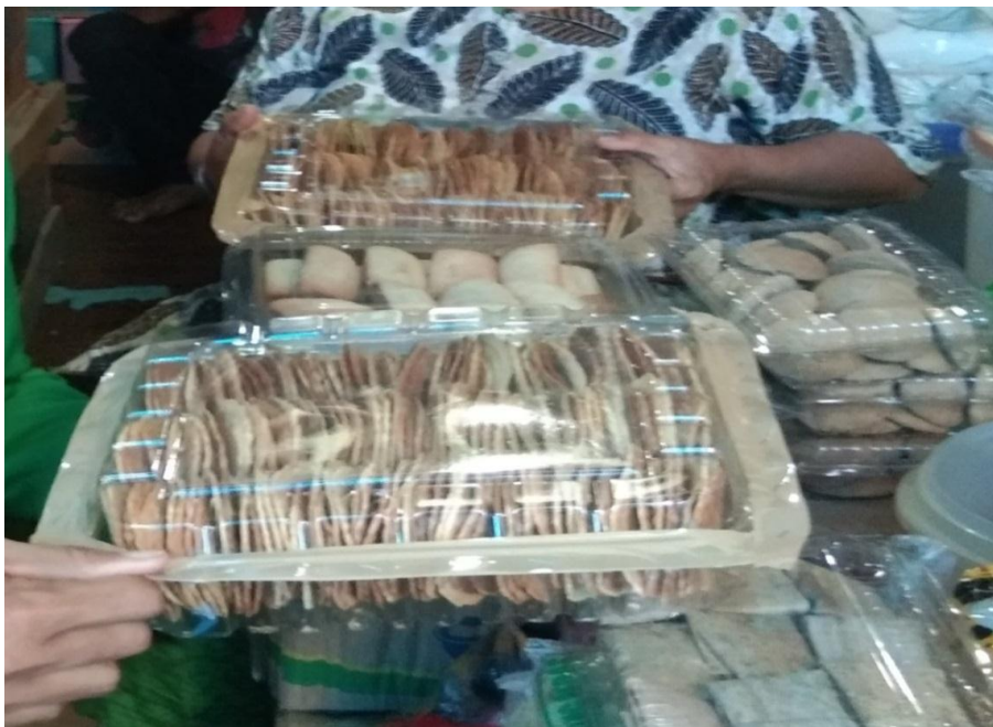
Wawancara dengan Putri selaku penjual produk kemasan di Pasar Tinambung Kabupaten Polewali Mandar