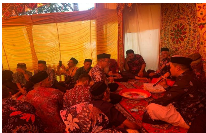
Gambar 4. 2 Passorong Pa'tedongang