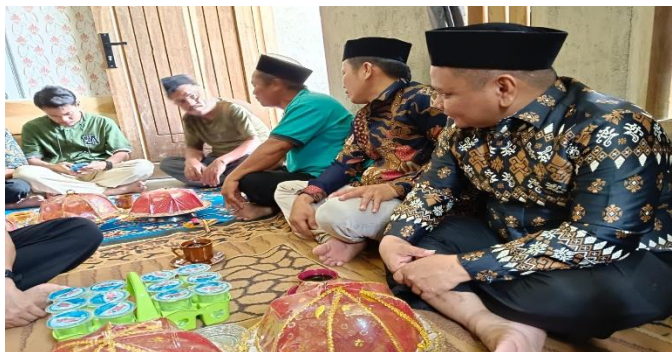
Gambar 4. 1 Perwakilan keluarga pihak laki-laki Mambaha (melamar)