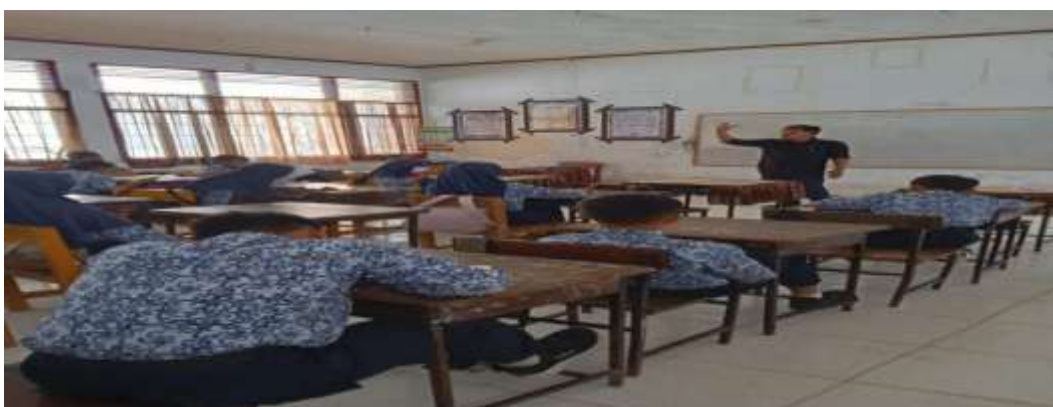
Gambar 11. Peserta didik sedang Mendengarkan Penjelasan dan Mencatat.