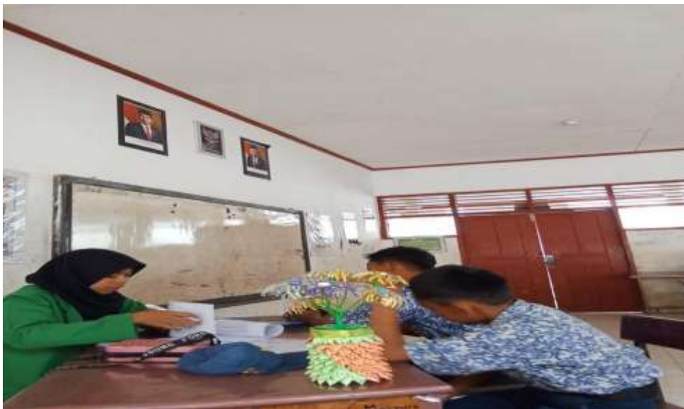
Gambar 5. Wawancara Peserta Didik Kelas VIII