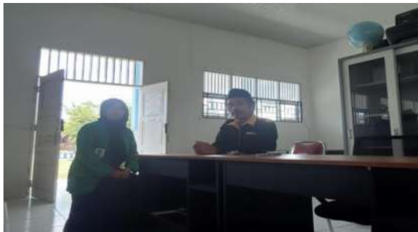
ambar 1. Wawancara Kepala Sekolah