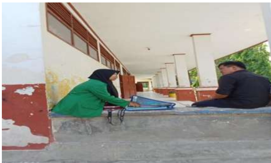
Gambar 2. Wawancara Guru Pendidikan Agama Islam