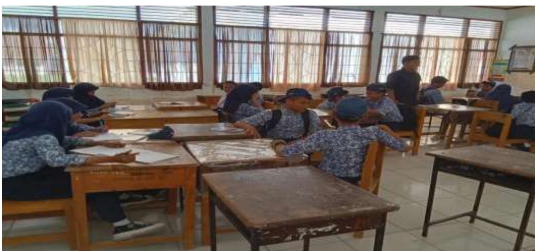
Gambar 9. Proses Kerja Kelompok.