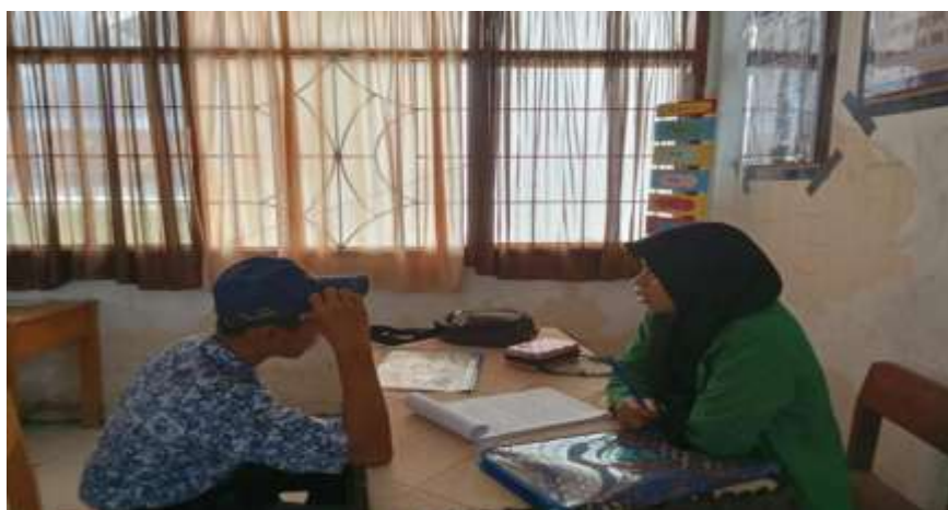
Gambar 3. Wawancara Peserta Didik Kelas VIII