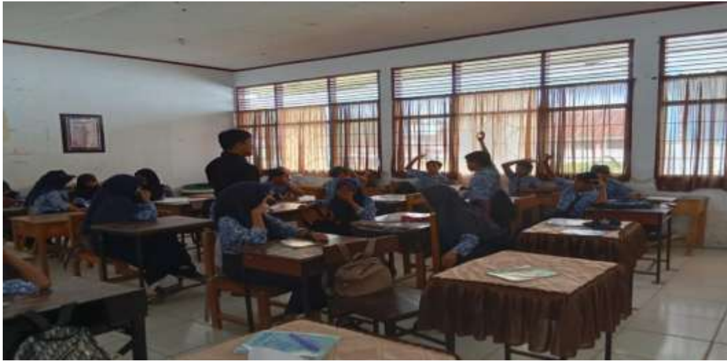
Gambar 12. Proses Tanya Jawab.