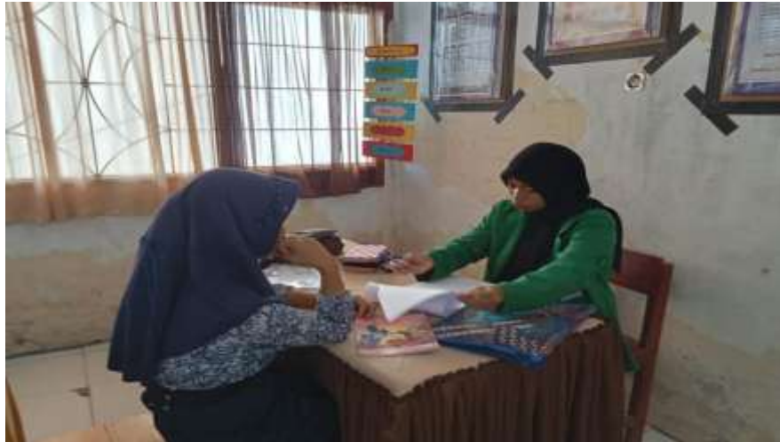
Gambar 4. Wawancara Peserta Didik Kelas VIII