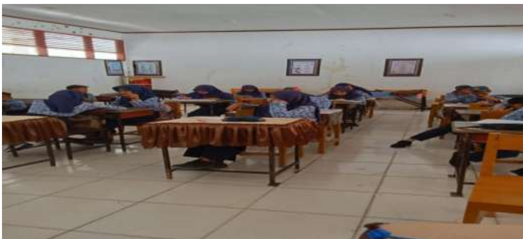
Gambar 8. suasana kelas VIII Saat Proses Pembelajaran Metode Ceramah.