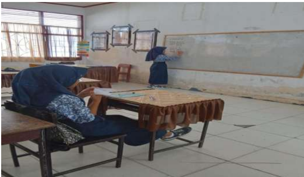
Gambar 10. Proses evaluasi.