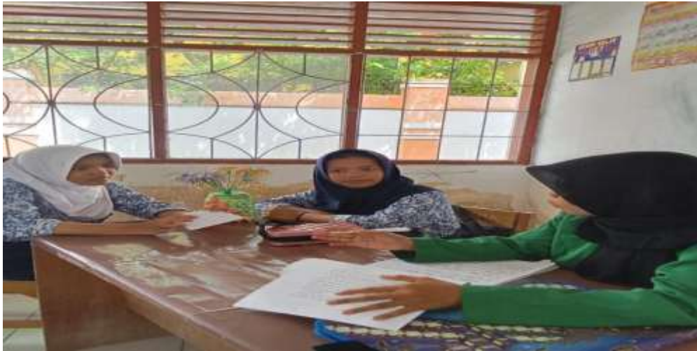
Gaambar 6. Wawancara Peserta Didik Kelas VIII