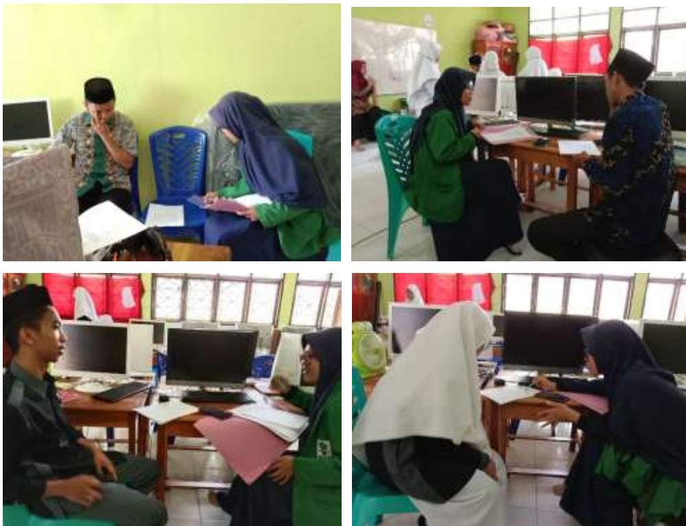
Wawancara dengan Pembina, Tendik dan Peserta Didik