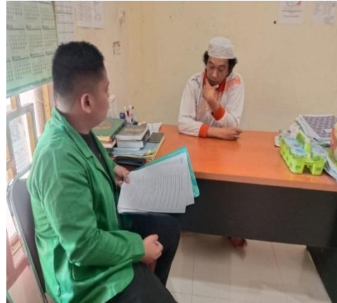
Foto dengan penjual