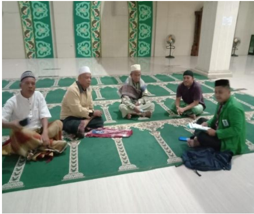
Foto dengan pengurus masjid