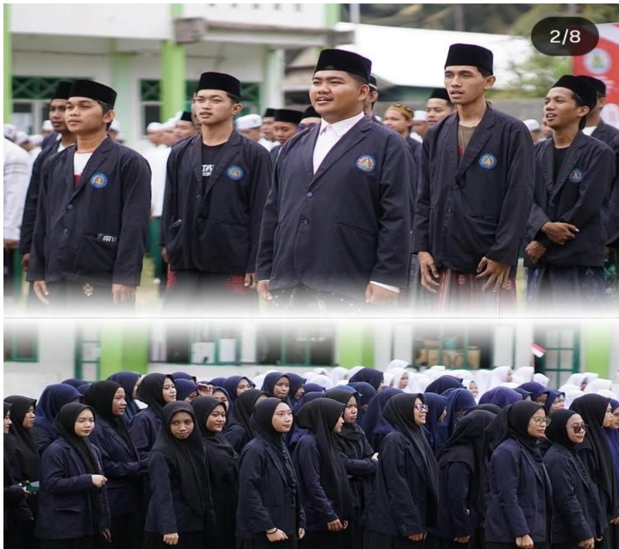
Gambar 1.3 Kegiatan Santri, Santriwati dan Ustaz