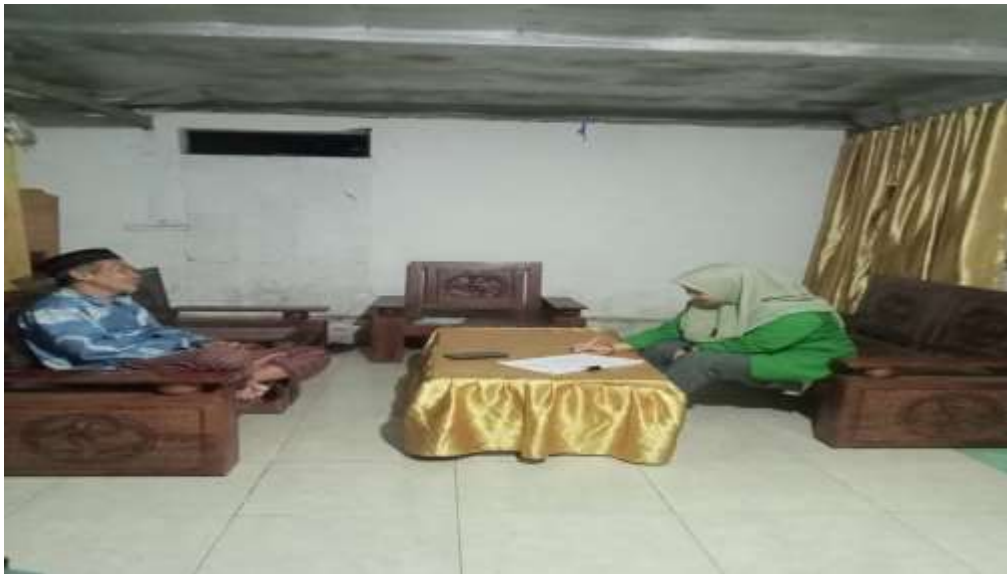
Gambar 5: Wawancara Bapak H.Muju (Pelaksana Zakat Mal/Muzkki)