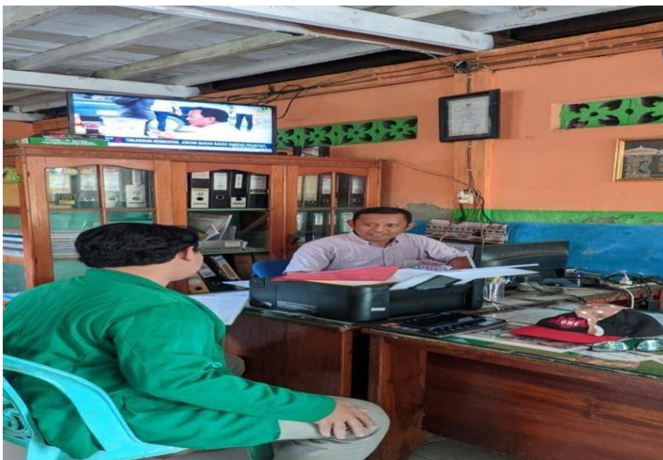
Wawancara dengan sekretaris dari UPK Tomepayung