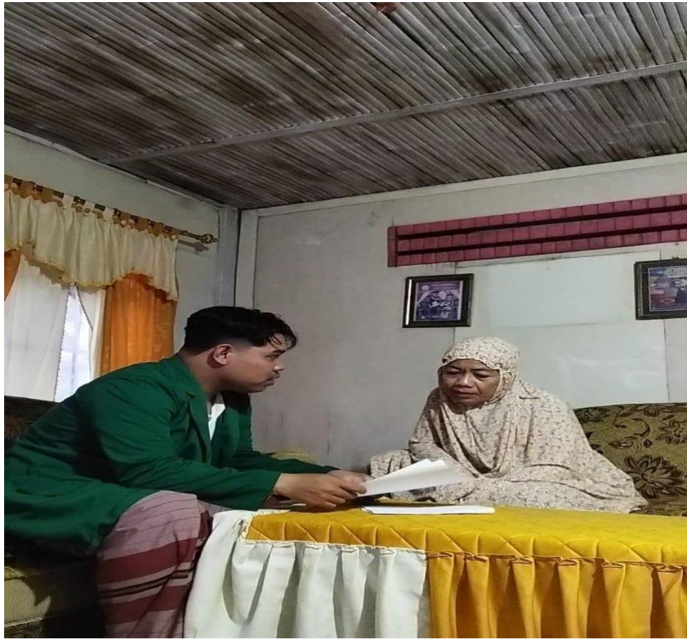
Wawancara nasabah UPK Tomepayung