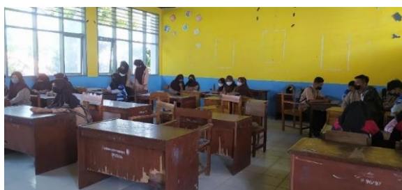
Gambar 3 Pelaksanaan diskusi