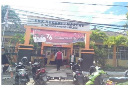
Gambar 1 SMK Negeri 2 Majene