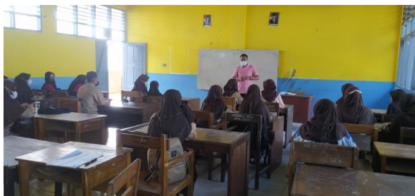
Gambar 2 Persiapan Kelompok Sebelum Diskusi