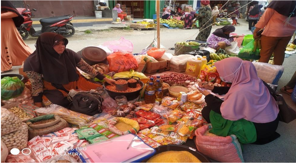
Gambar 1. Wawancara bersama dengan ibu hafsa selaku penjual bumbu dapur