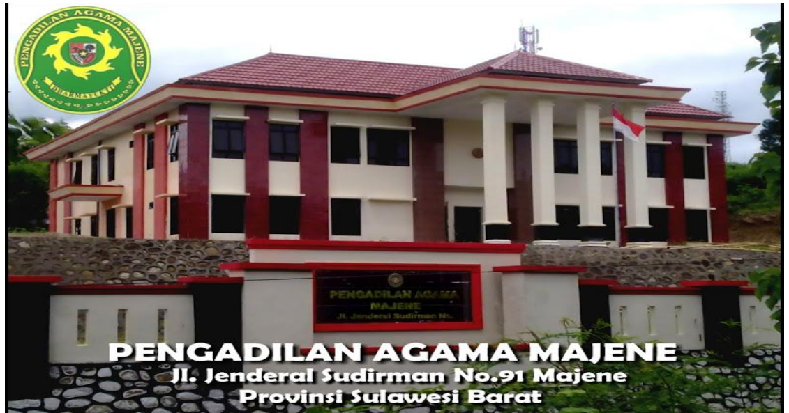
Gedung Pengadilan Agama Majene