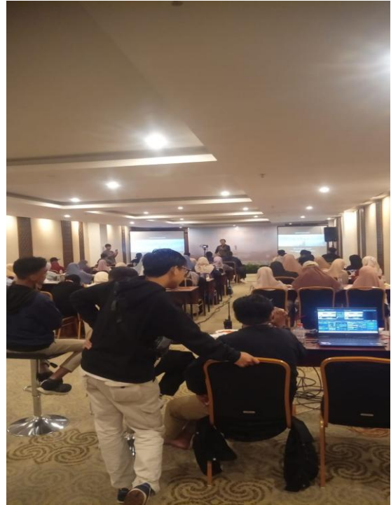
Kegiatan KEY Yuk Ngaji Makassar