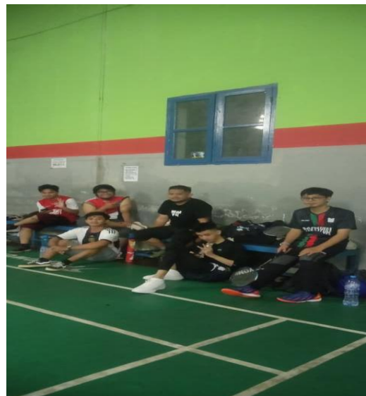
Kegiatan Olahraga Yuk Ngaji Regional Makassar untuk memperkuat silaturrahi