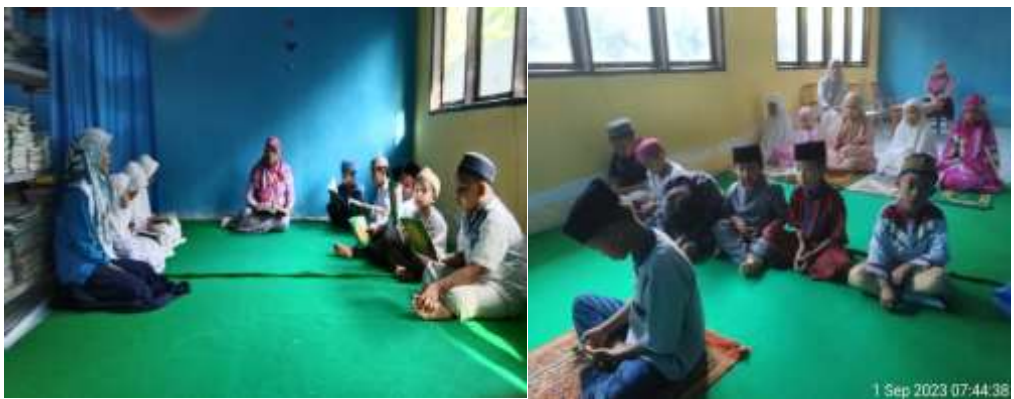
Kegiatan pembiasaan Jumat religius