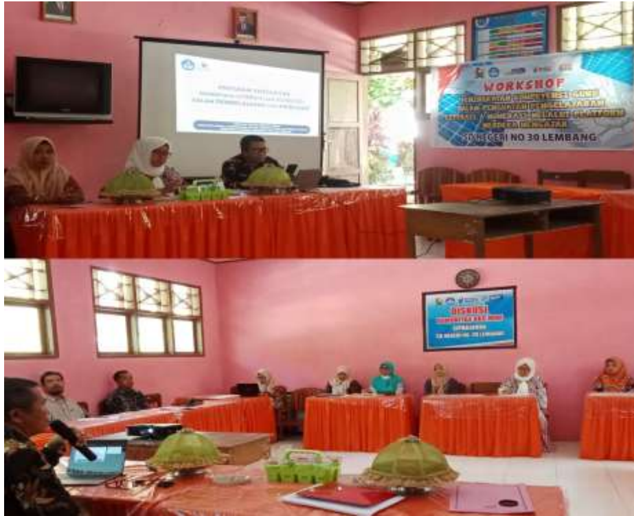
Kegiatan Workshop Pemanfaatan TIK dalam Pembelajaran Sekolah Penggerak