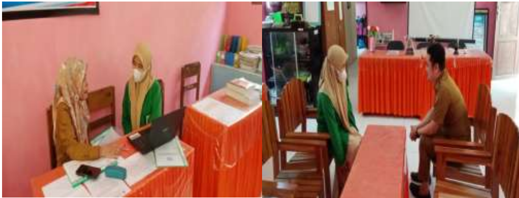
Wawancara dengan Pendidik mata pelajaran Pendidikan Agama Islam dan Operator Sekolah