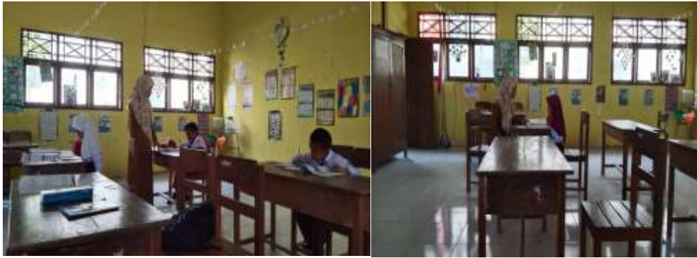
Kegiatan pembelajaran mata pelajaran Pendidikan Agama Islam kelas I