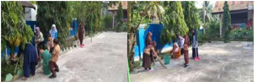
Kegiatan pembiasaan Sabtu bersih