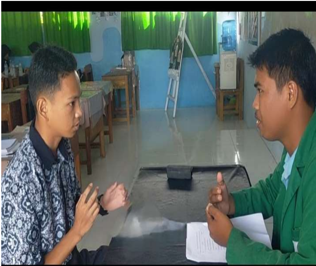
Gambar 5. wawancara terhadap peserta didik untuk memperkuat data hasil penelitian.