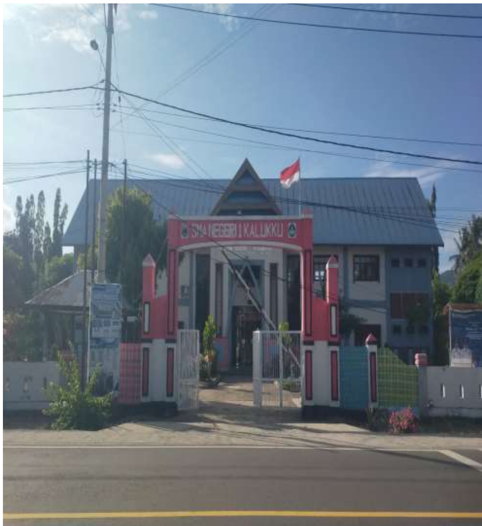
Gambar 1. UPTD SMAN 1 Kalukku