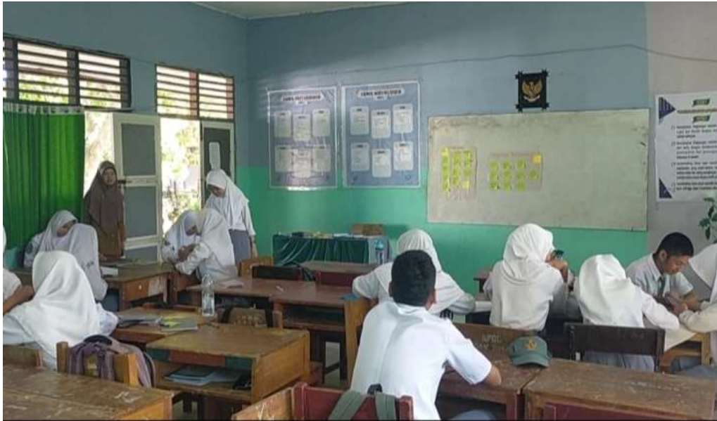
Gambar 3. proses belajar. langkah awal guru melaksanakan peran sebagai pendidik menyiapkan bahan ajar pembinaan, fasilitator, mendorong peserta didik aktif. Termotivasi akan kata kata terhadap karakter peserta didik dengan menyiapkan bahan ajar