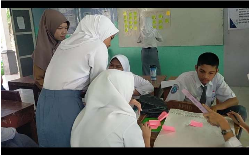
Gambar 4. proses belajar. Dari pengamatan peneliti guru sebagai fasilitator, pembina, bahan ajar seperti kertas guna agar peserta didik tertarik pada minat belajar