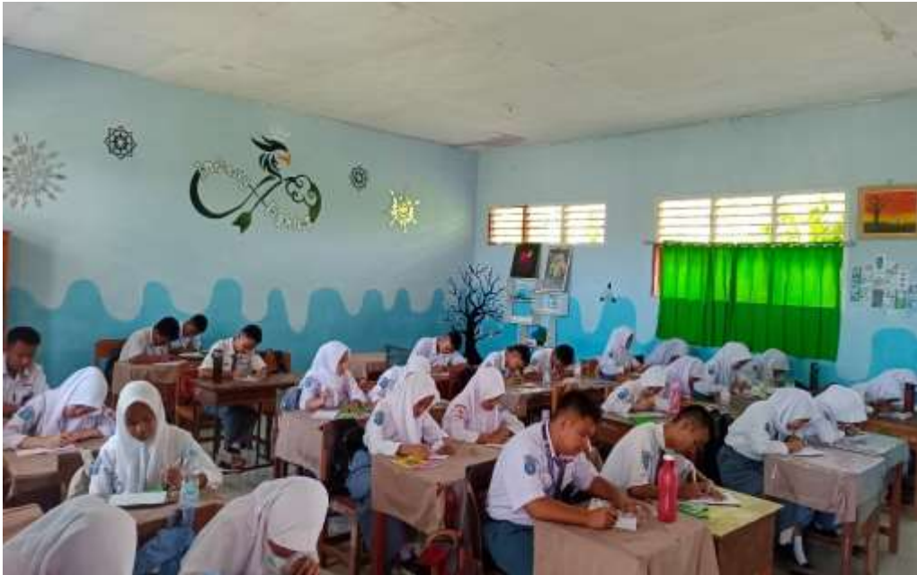
Gambar 2. proses belajar. Langkah awal guru PAI sebagai pendidik menyiapkan lembar kerja peserta didik.