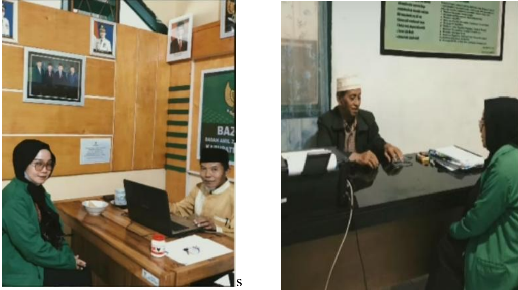
Gambar 1.1 Wawancara dengan pengurus BASNAZ di kabupaten majene.