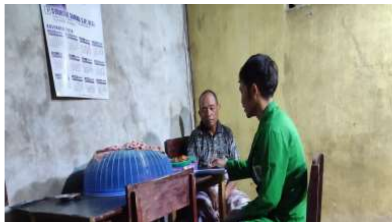
Wawancara dengan Bapak Alim