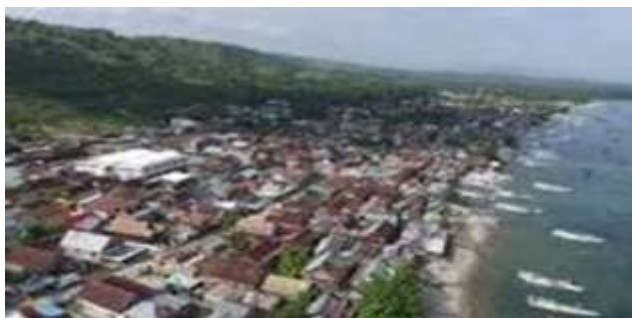
Gambar geografis desa pambusuang

Saat ini penduduk desa pambusuang berjumlah 5.108 jiwa, terdiri atas penduduk laki-laki 2.581 jiwa dan penduduk perempuan sebanyak 2.701 jiwa. Keseluruhan jumlah penduduk tersebut terakomodasi kedalam lima wilayah pemukiman yang disebut sebagai Dusun.