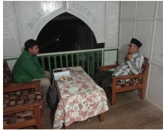
Ket: Wawancara Kepada Tokoh Agama di Desa Pampusuang