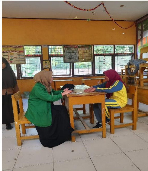
( Wawancara dengan siswa SDN 026 Banua Baru )