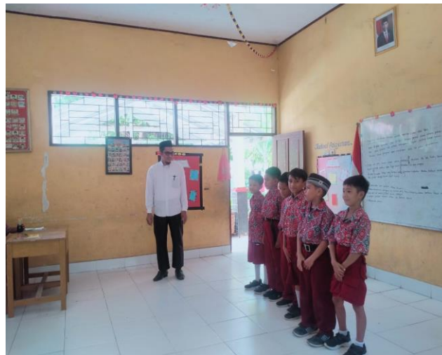
Gambar 3. Guru mengarahkan peserta didik latihan membaca Q.S Al-Alaq