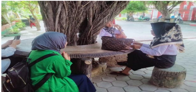
Wawancara dengan kepala sekola SDN 026 Banua Baru