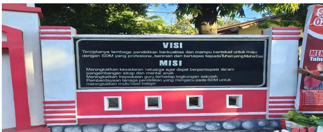
Visi Misi SDN 026 Banua Baru