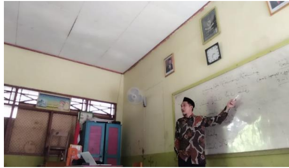
Gambar 1. Guru PAI menjelaskan materi Q.S Al-Alaq dengan metode ceramah