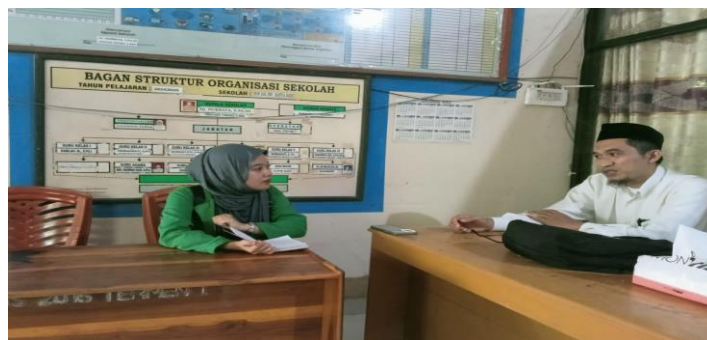
Wawancara dengan Guru Agama SDN 026 Banua Baru