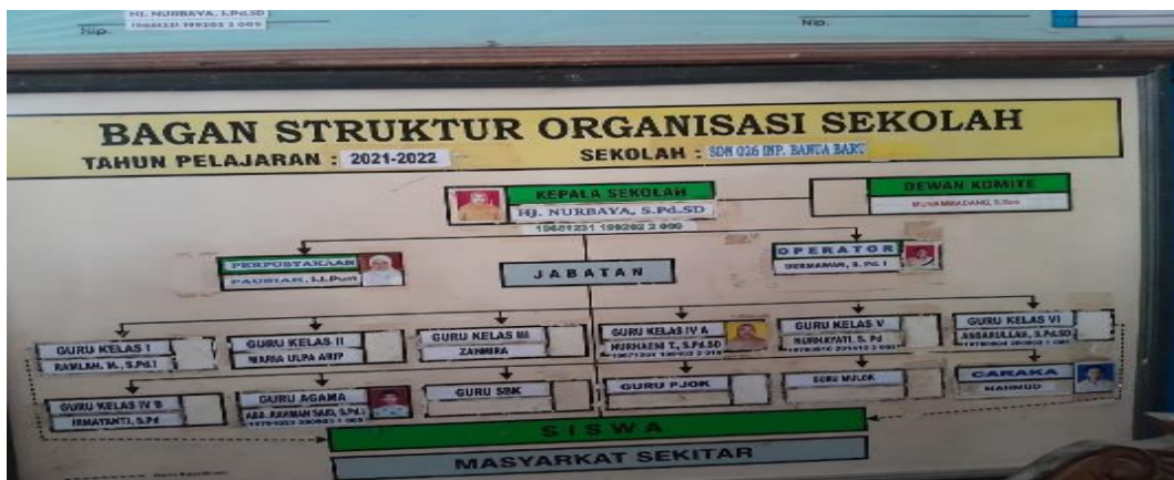
Struktur Organisasi SDN 026 Banua Baru