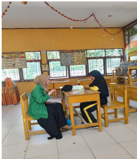
(Wawancara dengan siswa SDN 026 Banua Baru)