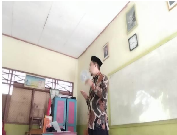
Gambar 2. Guru PAI mendemonstrasikan pembacaan Q.S Al-Alaq