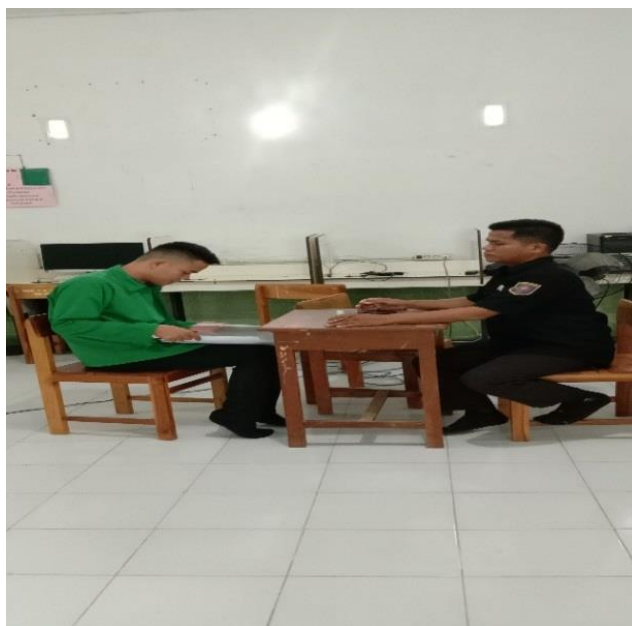
Gambar: 4.3 Wawancara guru pembina

Respon peserta didik dalam mengikuti kegiatan ekstrakurikuler/belajar Alhamdulillah sangat positif dan antusias, memang awa-awal kami agak memaksakan mereka tetapi seiring berjalannya waktu peserta didik sudah dengan kesadaran sendiri aktif dalam kegiatan ekstrakurikuler dan mereka melakukan atas kesadaran sendiri. 5