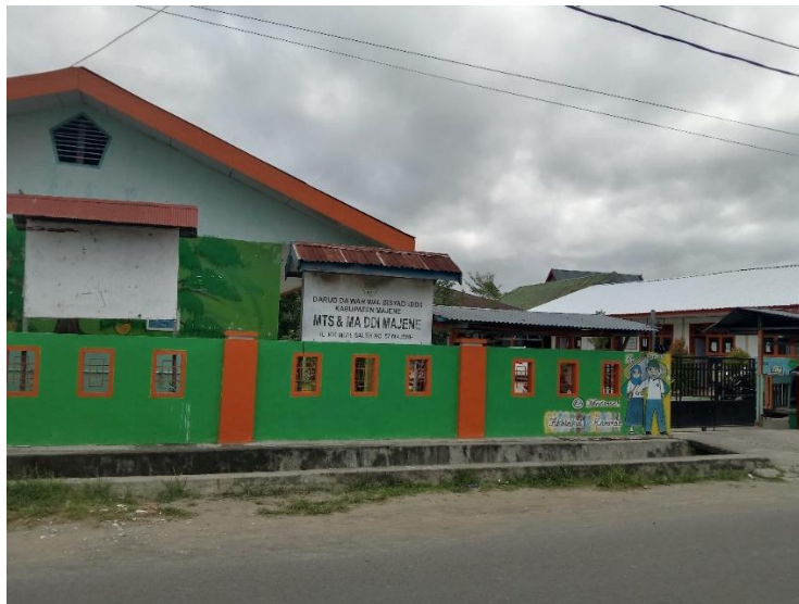
Gambar: 4.1 Terlihat dari depan MA DDI Majene.

Setelah dilakukan observasi, maka didapatkan hasil gambaran tentang sekolah tersebut. Berikut gambaran hasil observasi di MA DDI Majene.