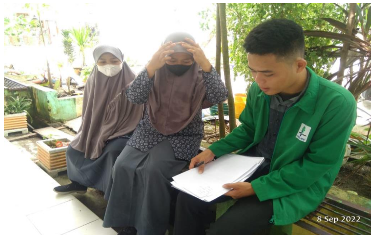
Gambar: 4.13 Wawancara peserta didik

Penjelasan dari hasil wawancara peserta didik tersebut memberikan informasi kepada peneliti bahwa peserta didik merasa nyaman dan aman di lingkungan sekolah karena tidak ada lagi perbuatan peserta didik yang mengganggu sesama peserta didik lainnya. Lingkungan sekolah yang nyaman tentu sangat berpengaruh terhadap kenyamanan dalam hal belajar.