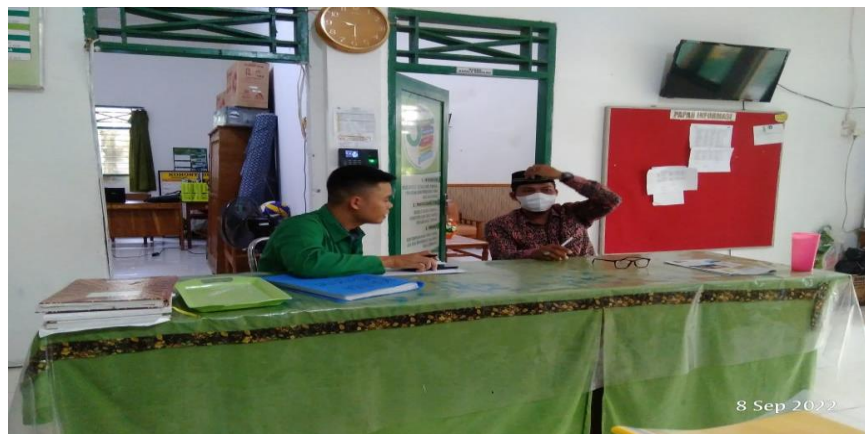
Gambar: 4.8 Wawancara kepala madrasah

Karakter religius adalah gabungan dari semua perilaku baik yang dilakukan yang ujungnya adalah mengarah kepada Allah swt, dan itu merupakan kebiasaan. 16