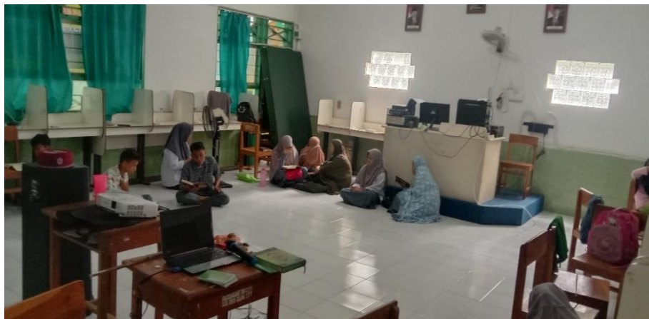
Gambar: 4.7 Peserta didik murojaah dan mnghafal

Dari keterangan bapak Saharuddin salah satu guru pembina kegiatan ekstrakurikuler tersebut bahwa untuk menghafal peserta didik diberikan waktu tertentu memperlancar hafalan sebelum menyetor hafalan ke guru pembina. Proses itu berlaku kepada semua peserta didik dalam kelompok yang sudah dapat menghafal .