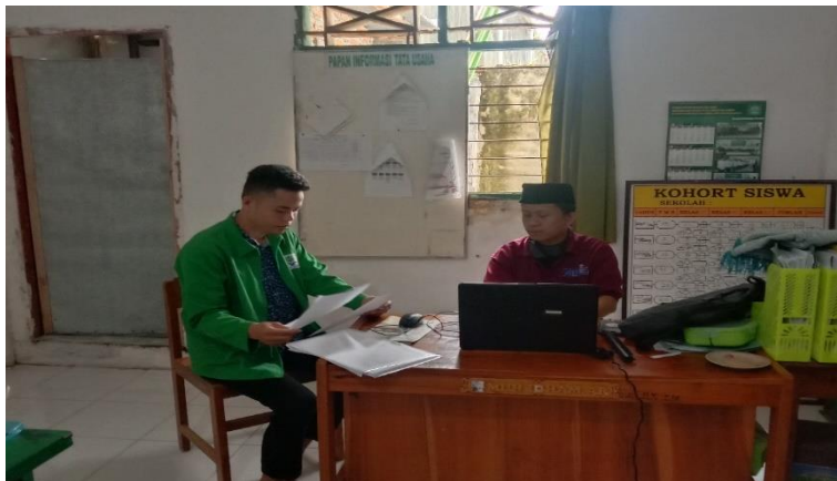
Gambar: 4.6 Wawancara guru pembina

berhadapan langsung dengan peserta didik atau praktek dalam hal membaca agar peserta didik langsung memahami. Karena memang membaca Al-Qur'an khususnya di makharijul huruf melafazkan harus dengan praktek agar sesuai atau hak-hak huruf dapat terpenuhi sesuai kaidah bacaan yang benar. 8