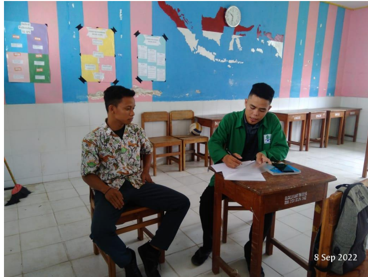
Gambar: 4.11 Wawancara peserta didik

Dari pernyataan peserta didik tersebut peneliti mendapatkan informasi yang sejalan dengan pernyataan guru pembina bahwa peserta didik sudah aktif dalam semua kegiatan dan muncul kebiasaan baik dalam keseharian baik di lingkungan sekolah atau di luar lingkungan sekolah, dan itulah yang disebut dengan karakter religius.