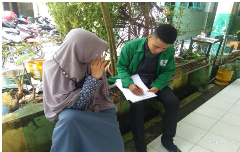
Gambar: 4.12 Wawancara peserta didik

Sudah tidak ada lagi perkelahian, pesrta didik seperti biasanya di sekolah waktu belajar ya belajar, waktu istirahat ke kantin, dan ada juga kumpul cerita bersama teman-teman. Perkelahian, saling mengejek sudah tidak ada lagi di lingkungan sekolah. 22