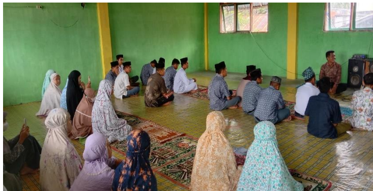
Gambar: 4.9 Suasana setelah shalat berjamaah

Peserta didik sudah aktif sesuai harapan bahkan sangat antusias diluar perkiraan kami, sudah tidak menjadi beban bagi mereka. Kegiatan ini sangat berpengaruh karena yang tadinya peserta didik malas belajar, malas ikut shalat berjamaah, malas baca Qur'an bahkan peserta didik yang mentalnya kurang baik suka marah kalau ditegur bisa berubah setelah ikut kegiatan ekstrakurikuler karena terus menerus dapat arahan dan berbaur dengan sesama. 18