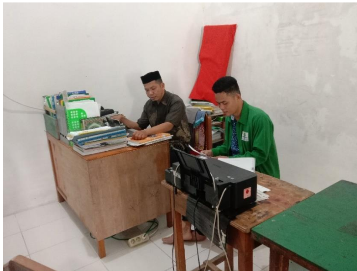
Gambar: 4.4 Wawancara guru pembina

Dalam setiap kegiatan pasti ada peserta didik yang tidak aktif tetapi itu sangat sedikit, Alhamdulillah peserta didik sangat antusias dan dapat diperkirakan 90 persen peserta didik aktif dalam kegiatan ekstrakurikuler ini. Artinya secara umum sudah aktif dalam kegiatan. 7