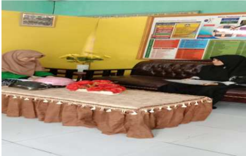
Foto bersama guru PAI pada saat validasi soal

Foto bersama kepala sekolah pada saat pemberian surat izin penelitian sekaligus melakukan wawancara terkait profil sekolah