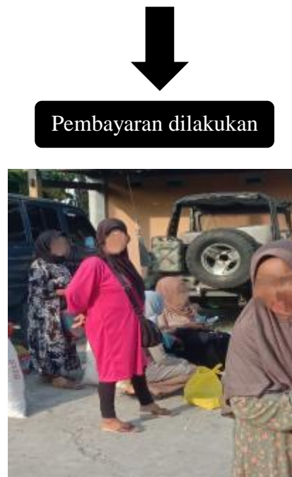
Gambar IV.2. Proses pembayaran