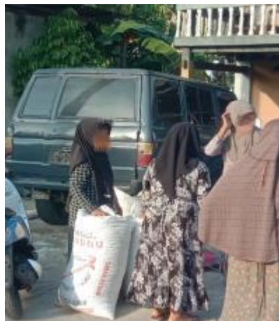
Gambar IV.2. Proses transaksi berlangsung (Dokumentasi Peneliti, 2025)

Pembeli menentukan harga sepihak tanpa tawar menawar