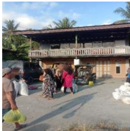
Gambar IV.1. Pembeli mengangkat kakao ke pangkalannya setelah berebutan