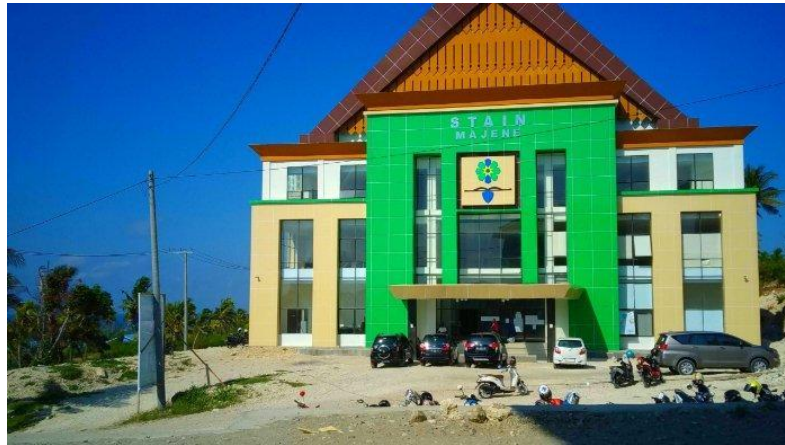
Gambar 4.1 Gedung STAIN Majene