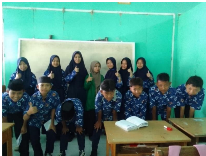
Dokumentasi bersama guru akidah akhlak dan peserta didik kelas VIII A di MTs Guppi Majene