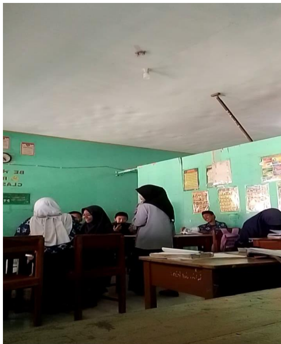
Foto penerapan model kooperatif tipe snowball throwing yaitu meminta peserta didik untuk membuat pertanyaan.