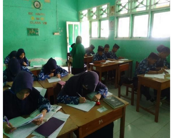
Foto saat pembagian angket soal sebelum ( Pre-test ) dan sesudah ( Post-test ) penerapan model pembelajaran kooperatif tipe snowball throwing