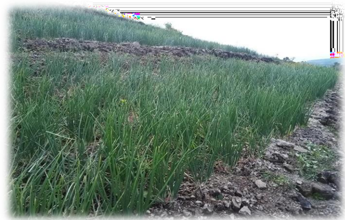
Gambar5 bawangmerah kebun warga