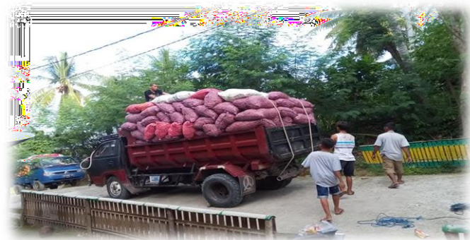
Gambar6. Proses pengangkutan bawang siap kirim