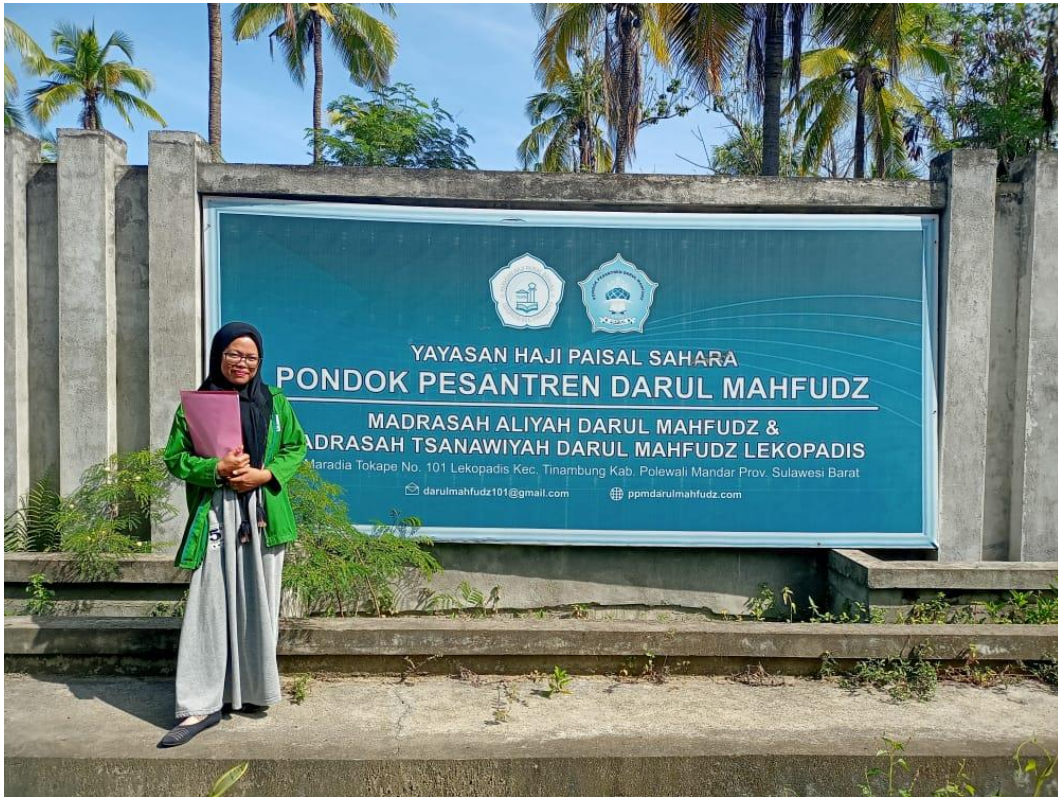
Foto Gedung Pondok Pesantren Darul Mahfudz Lekopa'dis