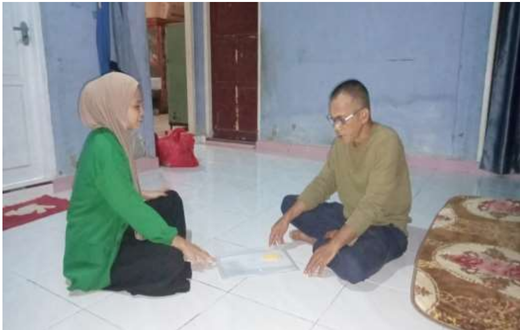
Ket. Wawancara oleh tokoh masyarakat