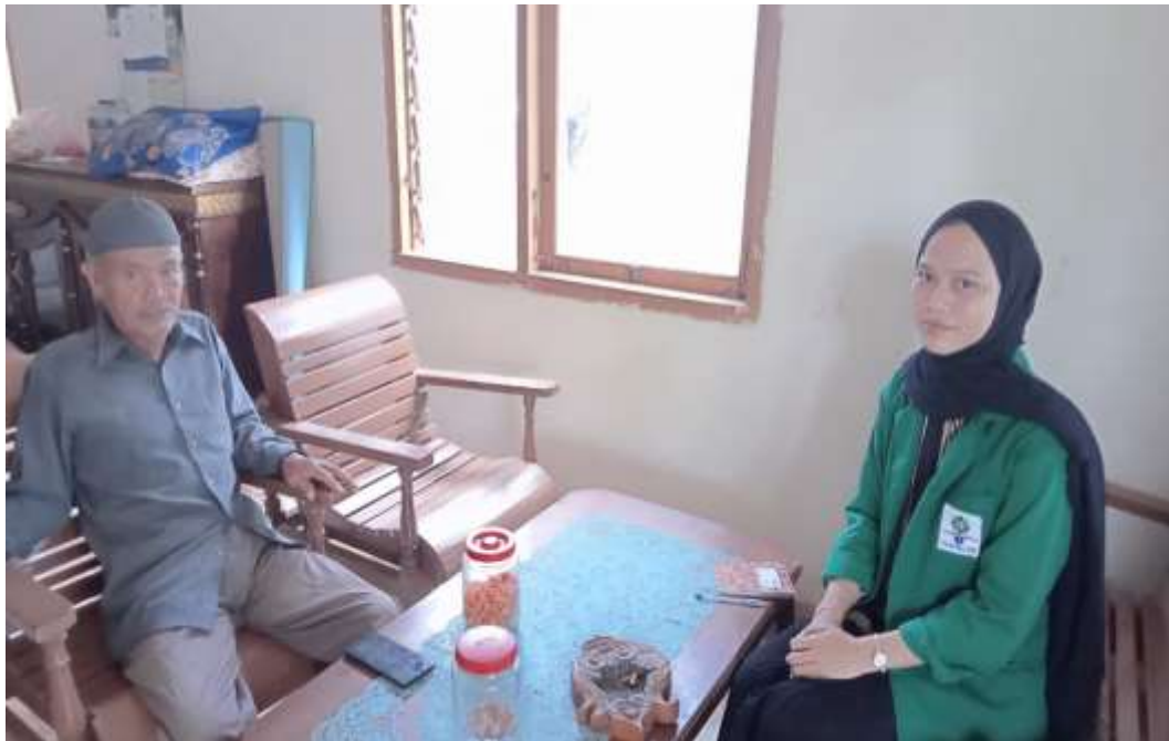
Ket. Wawancara oleh tokoh agama