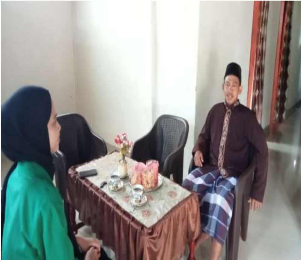
Ket. Wawancara oleh imam masjid