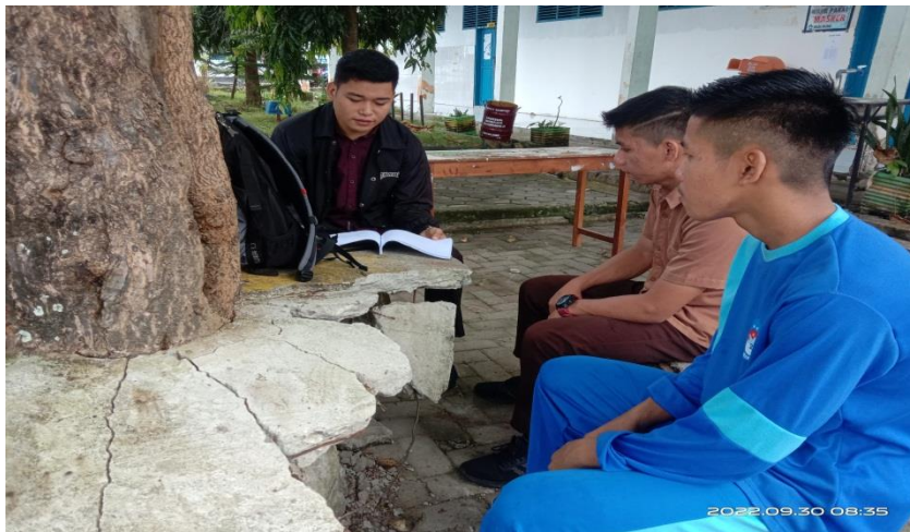
Gambar 5. Wawancara dengan peserta didik