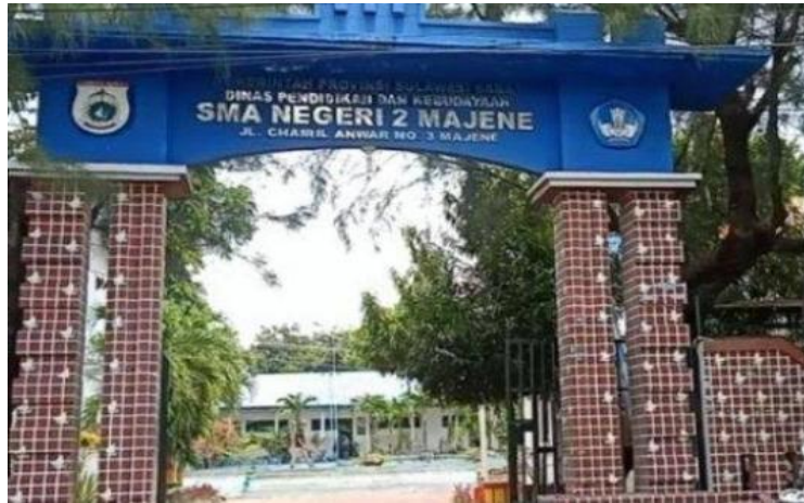
Gambar 1. Tampak depan SMA Negeri 2 Majene