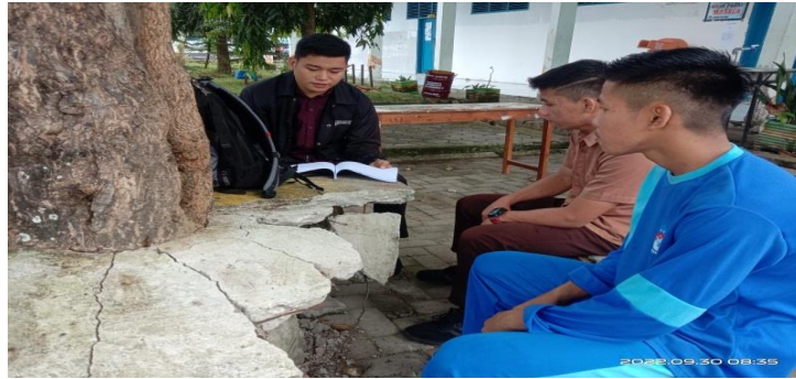
Gambar 4 . 6 wawancara dengan peserta didik

“Kami menyenangi Ahmad, ketika ia mengajar biasanya jarang memberikan tugas melalui tulisan tapi dia memberikan secara lisan penjelesan dari pak Ahmat sangat singkat dan, menurut kami para peserta didik kelas saya sendiri karena pak ahmat selaku wali kelas saya penejelasaanya muda sekali di pahami karena tidak terlalu banyak bicara tetapi ingin selalu mengangkat pola pikir peserta tersebut sehingga tidak bosan dalam mengajar karena dia memberika tugas satu dalam satu minggu tidak perna memberikan tuga berturut-turut dalam satu sehinga peserta didik, lebih suka ahmad dalam melakukan proses pembelajaran. 40