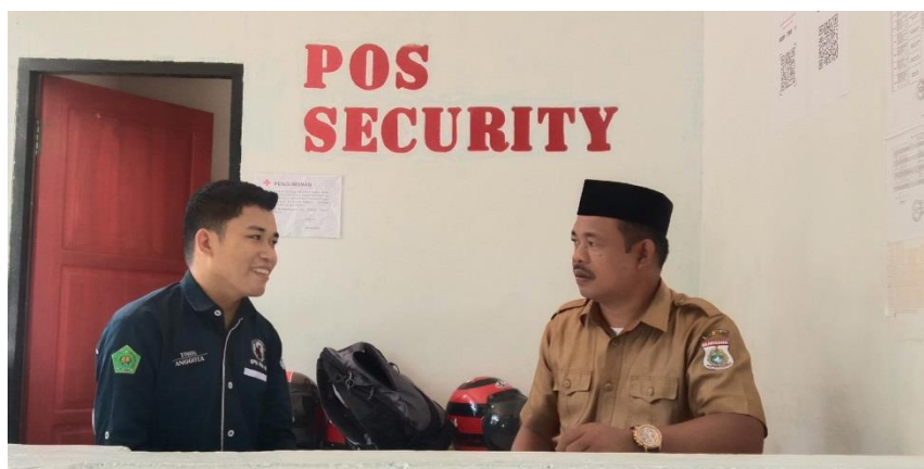
Gambar 6. Wawancara dengan guru PAI