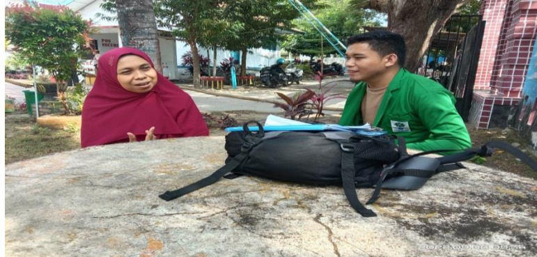
Gambar 4.1 Wawancara dengan guru PAI

juga peserta didik yang fokus memperhatikan guru ketika menjelaskan dan juga peserta didik gampang memahami pelajaran” 29