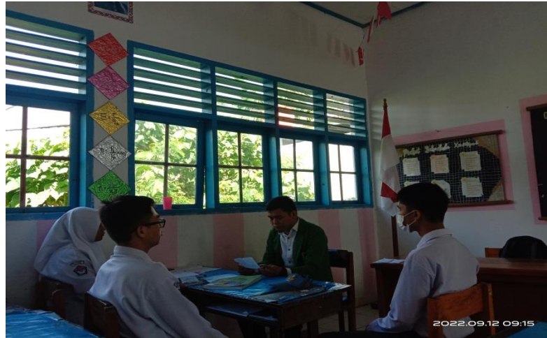
Gambar 4. Wawancara dengan peserta didik