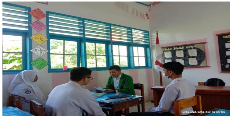
Gambar 4.4 Wawancara dengan peserta didik

“sikap belajar itu menurut saya adalah sikap yang harus dilakukan pada saat pembelajaran berlangsung, sikap saya ketika pembelajaran PAI selalu mendengarkan dan menyimak dengan serius dan menyukai pembelajaran PAI berhubungan dengan kehidupan dunia dan akhirat saya materinya kadang ada yang susah ada yang mudah, saya peserta didik tersebut dalam kelas X yang saya tahu ketika pembelajaran PAI suasana kelas tenang (itu pembelajaran PAI jam pagi) kalau di jam terakhir siang biasanya teman-teman nggak bisa fokus, sehingga sikap belajarnya kurang, jadi teman-teman tidak memperhatikan, ramai sendiri jadi itu untuk mengkondisikan, ini juga bisa jadi sebageian dari teman-teman dia kurang menyukai banyaknya materi tugas yang harus di baca dan di hafal dan itu membosankan dan terus yang ramai danbegurau itu banyaknya dari peserta didik laki-laki” 32