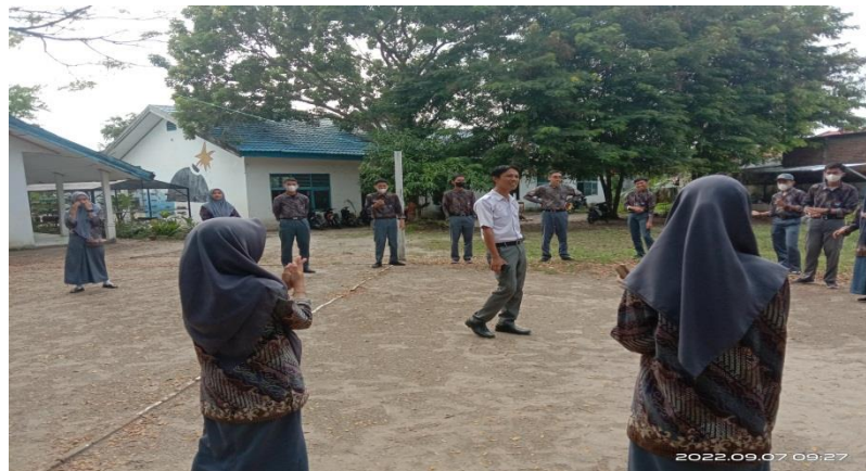
Gambar 3. Sikap belajar peserta didik