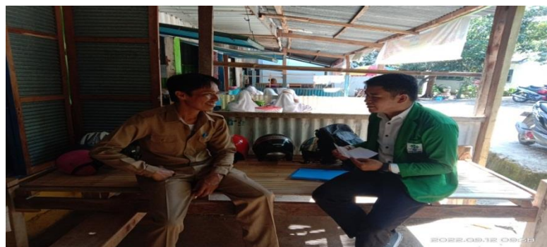
Gambar 4. 2 wawancara dengan guru PAI

“Sikap belajar peserta didik, peserta didik itu bermacam-macam ada yang suka dia sebenarnya dia mendengarkan ada yang fokus mengikuti ada memang yang diam tapi tekun, jadi sebagai guru ya harus memahami itu, jadi kalau kita ingin peserta didik ketika itu pembelajaran berlangsung, kan jaman sekarang kita harus memahami peserta didik, yang penting tugas di kerjakan dan materi itu harus tersampaikan” 30