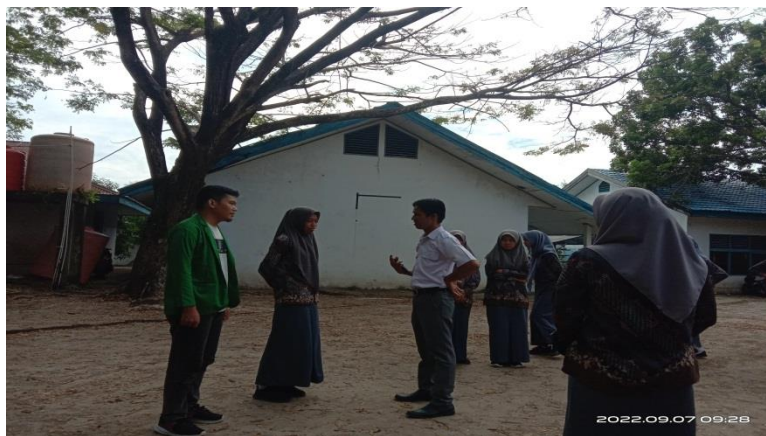
Gambar 4.6 sikap belajar peserta didik

“sikap belajar peserta didik secara umum adalah sikap yang di siplin, jadi selama saya mengajar itu jarang sekali peserta didik yang datang terlambat, kemudian ketika saya menyampaikan materi peserta didik juga mengikuti, kemudian saya menggunakan diskusi kelompok mereka juga aktif, kemudian ketika saya melakukan evaluasi pembelajaran kepada peserta didik juga mengikuti dan hasil juga lumanyang bagus 33,34