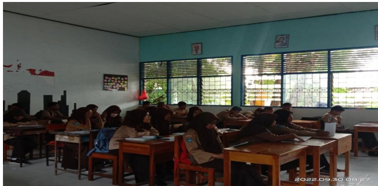
Gambaran 4.8 sikap Belajar peserta didik

“sikap saya ketika pembelajaran PAI, saya memperhatikan, berusaha untuk memahami, atau mencatat beberapa penjelasan (jika perlu di catat) karena saya suka pembelajaran PAI, bagi saya materinya mudah dan saya menyukainya bukan melihat dari segi materinya iya kak, tapi dari segi guru yang mengajar. kalau saya suka dengan ngajar guru tersebut, iya saya juga suka dengan pelajarannya ngitu kak” 35