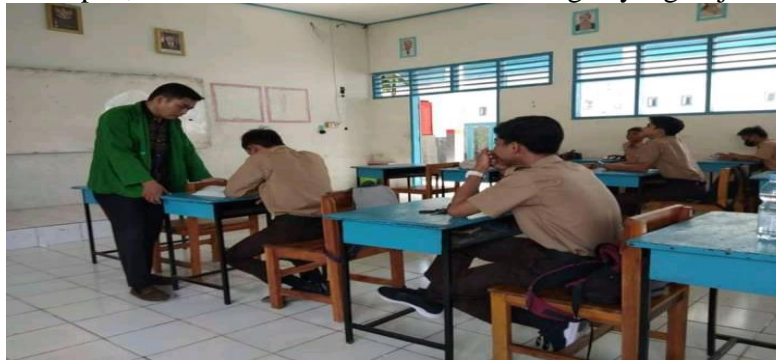
Gambar 4. 8 Wawancara peserta didik

merupakan pelajaran yang banyak kami sukai ditambah gurunya selalu bersemangat dalam mengajar, aktif dan tegas membuat kami mudah mengerti apa yang di sampaikan terkait dengan kehidupan yang dialami. Hal ini dalam kehidupan,selalu mencontohkan isi materi dengan yang terjadi sekarang