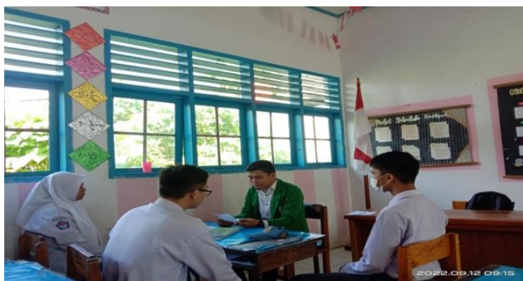
Gamabar 4.4 Wawancara dengan peserta didik

mahari guru PAI menekankan banyak bercerita. Hal ini dimaksudkan agar mereka lebih banyak mendengarkan dari pada menulis, sebab kalau guru yang menjelaskan peserta didik menulis maka pembelajaran akan sulit dipahami. Dan guru tersebut lebih suka peserta didik mendengarkan dari pada peserta didiknya ada yang menulis”. Di samping itu dalam mengajar tidak lupa memberikan senyuman kepada Peserta didik dan selalu berinteraksi kepada peserta didik baik dalam bertanya ataupun menjelaskan materi tidak lupa Ibu tersebut melakukan gerakan yang bebas seperti gerakan menggunakan tangan yang menjelaskan arti maksud suatu pernyataan, gerakan kaki yang melangkah kearah kanan-kiri, memosisikan diri lebih dekat pada siswa dan juga gerakan mimik wajah yang ramah dan senyum. 38