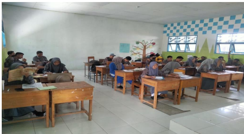
Gambar 4.5 sikap belajar peserta didik

“sikap belajar menurut saya adalah sikap seperti mendengarkan dan mencari dan mengamati onformasi baru, selama pembelajaran PAI, sikap saya cukup baik namun terkadang saya mearsa bosan jika materi yang di bahas kurang kurang bisa saya terima dan sulit masuk di otak saya terutama kalau materinya banyak yang harus di baca dan di hafal, bukan berarti saya tidak suka memperhatikan guru kadang kalau saya sudah malas dengan materinya” 33