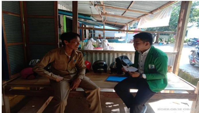
Gambar 4. 5 wawancara dengan guru PAI

wawancara tersebut dapat disimpulkan bahwa dan kita sebagai guru mempunyai pengalaman mengajar, dengan pengalaman dapat belajar lebih baik dan melakukan perbaikan kualitas mengajar, ketika dihadapkan pada situasi dan kondisi yang terjadi pada proses pembelajaran.