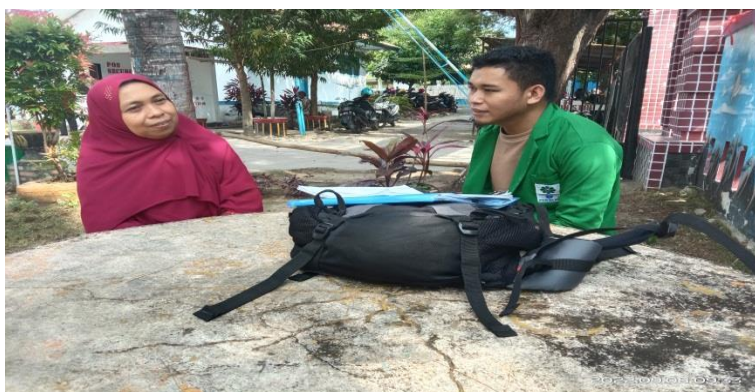
Gambar 4.3 wawancara dengan guru PAI

“Sebelum mengajar terlebih dahulu kita memiliki persiapan baik kepada materi yang harus dikuasai yaitu melalui rpp terlepas kepada guru itu sendiri bagaimana menyajikannya dan persiapan dalam diri sendiri. saya melakukan bermacam-macam gaya seperti gaya yang cenderung ceramah hal ini disebut dengan gaya klasik. Dalam artian dengan mata pelajaran pendidikan Agama islam harus banyak bercerita dimana guru itu semua menjelaskan. untuk lebih aktifnya agar tidak pasif pembelajaran maka dibarengilah dengan gaya gerak yang berupa tangan, dan gerakan kaki. 37