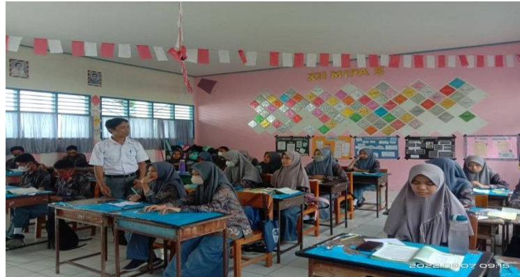
Gambar 4. 7 Observasi

tersebut mencotohkan tingkah laku, sikap sesuai dengan ajaran islam. Guru itu memulai pelajaran mengucapkan salam, berdoa, dan berpakaian islami yang menutup aurat. Kesemua itu akan tercapai kompetensi yang dimiliki oleh masing-masing tersebut sehingga anak-anak akan mencontoh dan tidak bosan terhadap pelajaran yang disampaikan oleh gurunya. 36