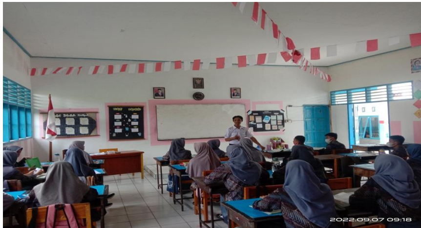
Gambar 7. Observasi kegiatan sikap belajar