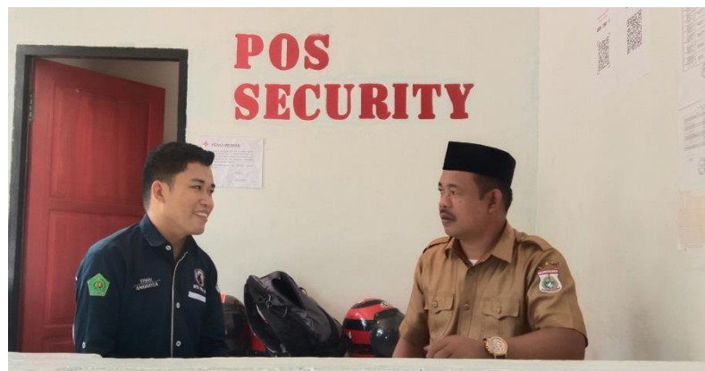
Gambar 4. 3 Wawancara dengan guru PAI

“dala proses pembelajaran yang selama saya lakukan diterapkan di sekolah atau terhadap peserta didik, pertama-pertama ketika masuk dala kelas kita masuk dalam kelas kita mengucapkan salam dan kemudian membuka pembejaran di awali dengan mukaddima pujian kepada allah salawat salam kepada rasulullah sebagai bahwa apa yang kita rasakan sampai hari ini atas izin Allah dan harapkan, guru dan siswa terbuka terbuka hidanya dsn rahmat melalui rasullah, sehingga pembelajaran efektif dan efesien yang kita lakukan pada saat proses pembelajran, kemudian selanjutnya kita absen terlebi dahulu setelah itu kita memancing peserta didik dan melalui kesepiapan peserta didik dalam proses pembejaran yaitu biasa disebut tentunya sebagai seorang guru harus lebih awal mencoba mengajak peserta didik mengingatkan kembali pelajaran yang perna di pelajari atau pelajaran sebelumnya” 31