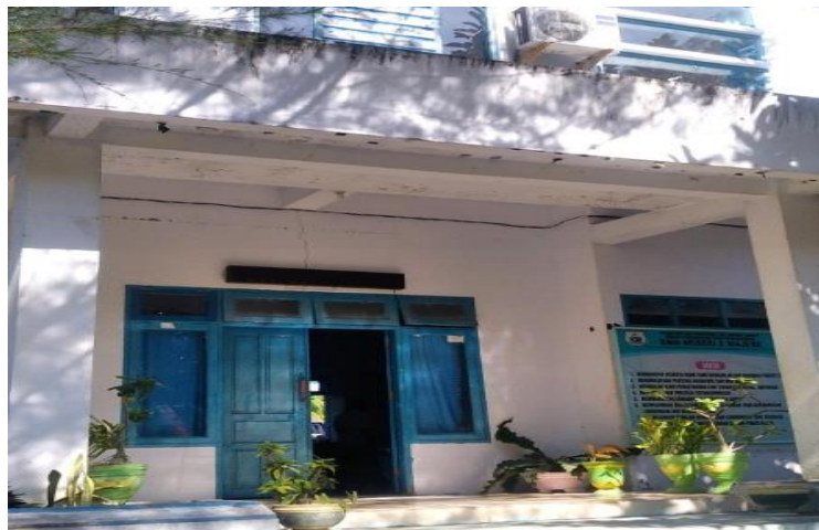
Gambar 2. Kantor guru SMA Negeri 2 majene