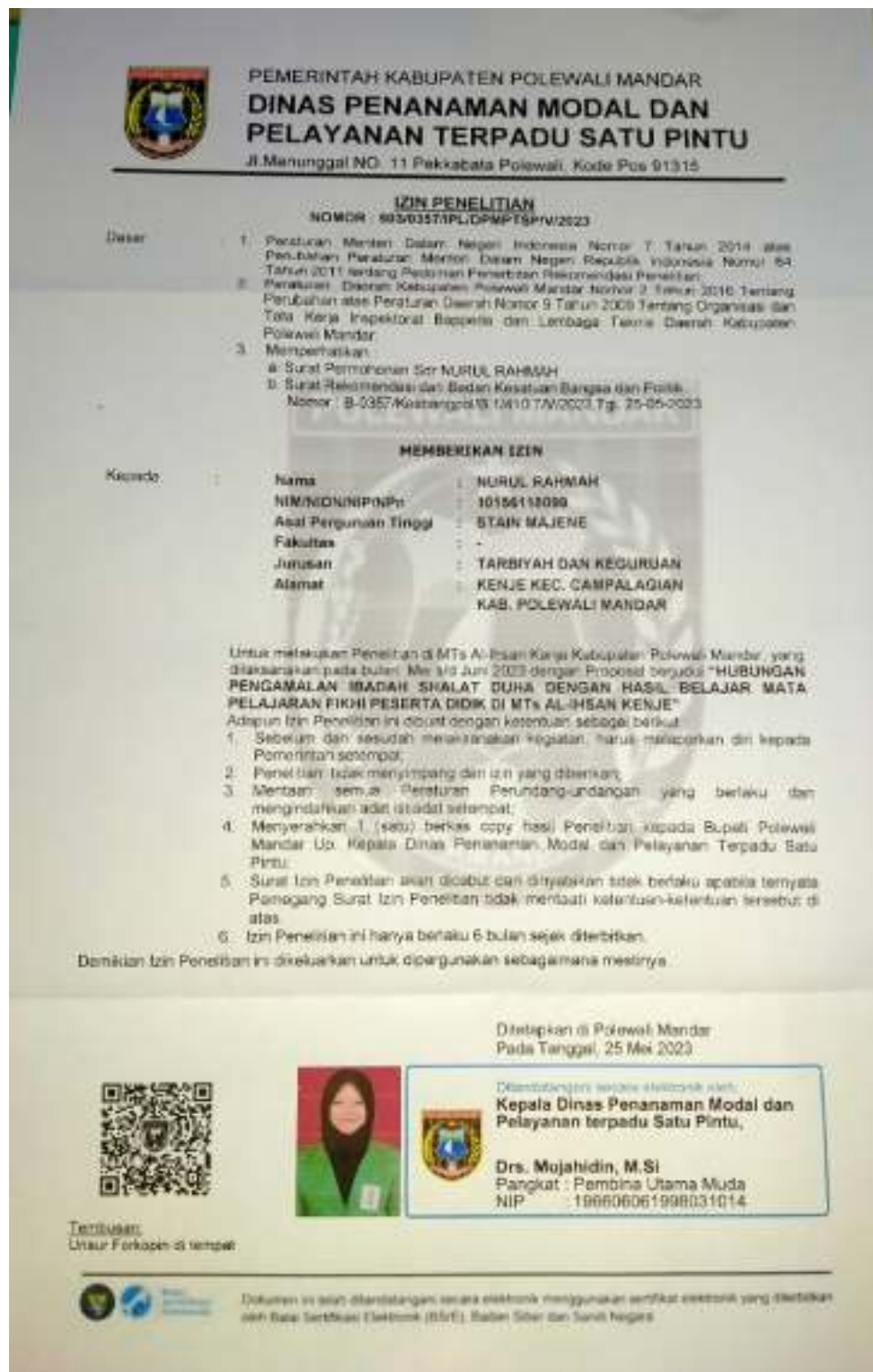
Lampiran 5. Gambar surat penelitian