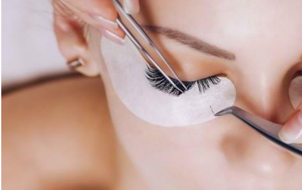
Gambar 3.1 prosedur pemasangan bulu mata extension