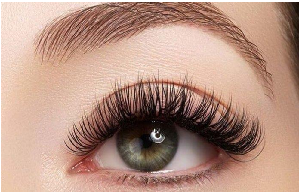
Gambar 3.4 Hasil Pemasangan Bulu Mata Extension