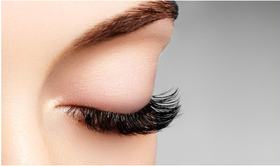
Gambar 3.3 Hasil Pemasangan Bulu Mata Extension