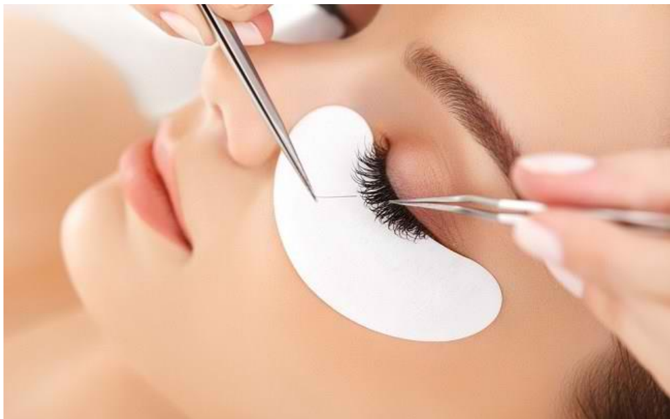
Gambar 3.2 prosedur pemasangan bulu mata extension