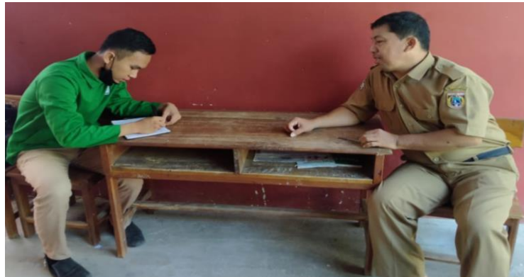
Wawancara dengan Wali Kelas