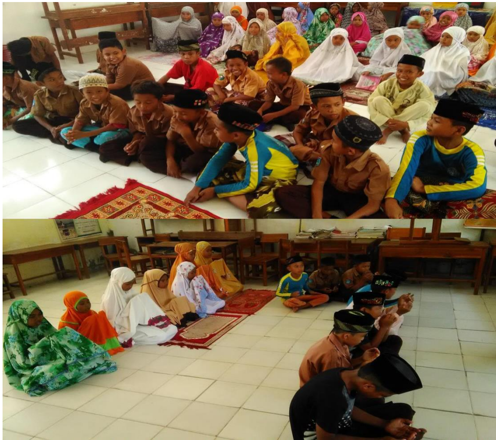
Kegiatan Salat Berjamaah SDN. No. 062 Inpres Sandangan