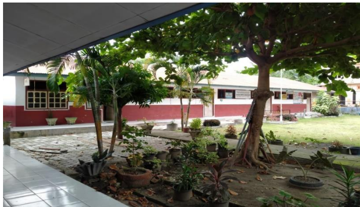
Gambar 4.1 Lingkungan sekolah SDN No. 062 Inpres Sandangan

SDN No. 062 Inpres Sandangan terletak di Desa Tangnga-Tangnga Kecamatan Tinambung Kabupaten Polewali Mandar dengan status sekolah negeri. Sekolah ini dikelilingi rumah warga dan jauh dari jalan raya sehingga keselamatan anak juga terjaga. Sekolah ini mempunyai visi yaitu terwujudnya mutu pembelajaran menuju pencapaian manusia berkualitas, cerdas, bertakwa dan berbudaya, dengan misinya yaitu meningkatkan kualitas guru melalui KKG / pelatihan, meningkatkan mutu pendidikan dengan cara proses pendekatan PAKEM, meningkatkan kunjungan guru atau komite ke rumah siswa yang bermasalah, dan menciptakan masyarakat peduli pendidikan anak melalui PSM. Kemudian, tujuannya yaitu dapat meraih prestasi akademik minimal tingkat kabupaten, menghasilkan siswa yang memiliki keterampilan, meraih prestasi non akademik minimal tingkat kabupaten, menciptakan kepedulian masyarakat terhadap pendidikan anak, memberdayakan komponen masyarakat dalam menanggulangi berbagai ancaman dampak globalisasi.