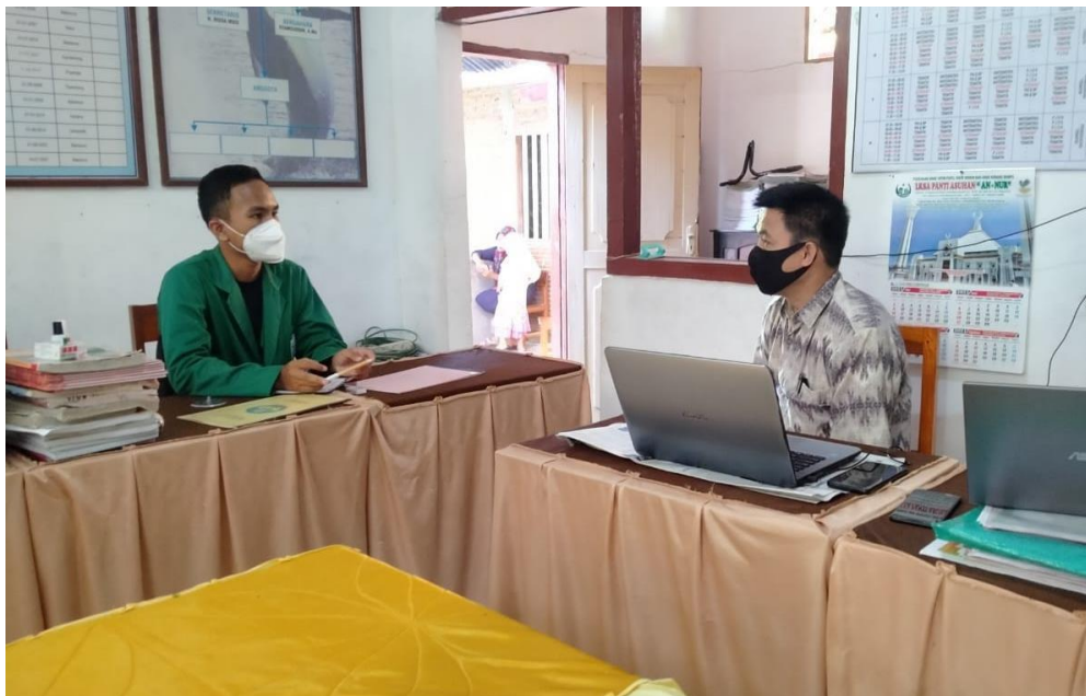
Wawancara dengan Guru Pendidikan Agama Islam