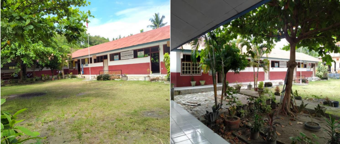
Lingkungan sekolah SDN No. 062 Inpres Sandangan