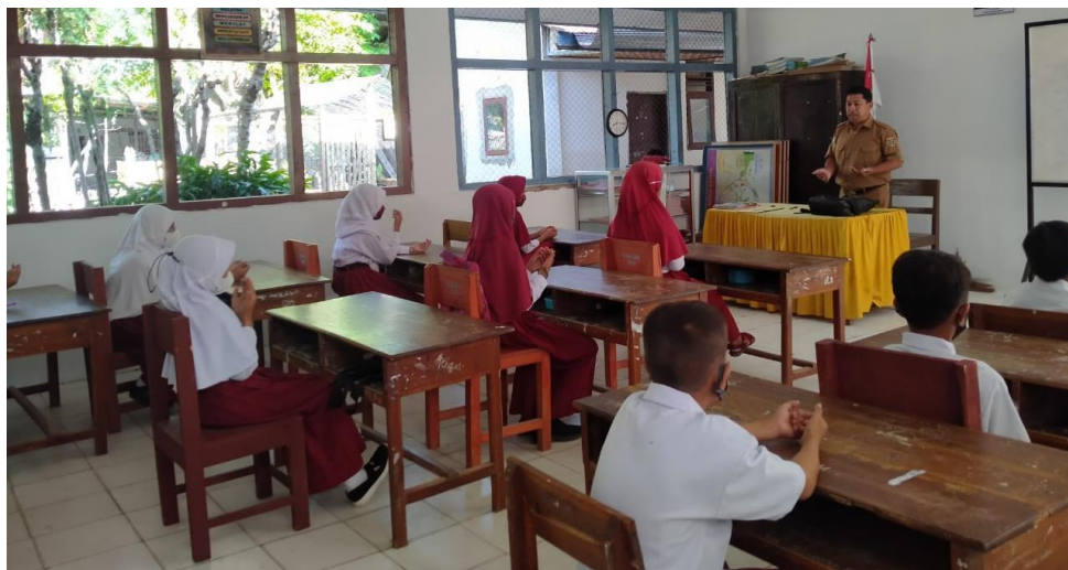
Proses Pembelajaran yang diawali dengan membaca doa dan surah pendek.