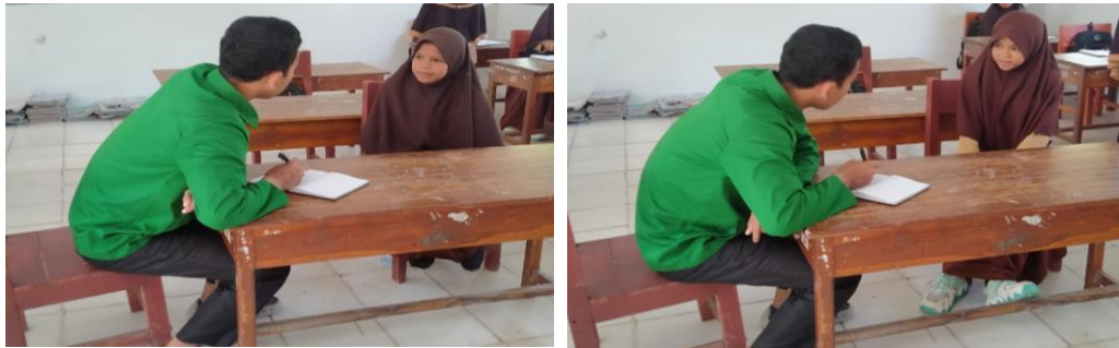
Wawancara dengan Peserta Didik