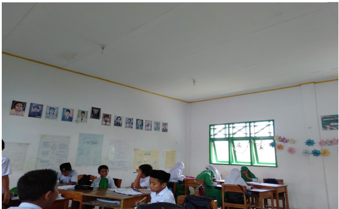
Gambar. 10 suasana kelas saat ingin melakukan wawancara peserta didik pada tanggal 9 November