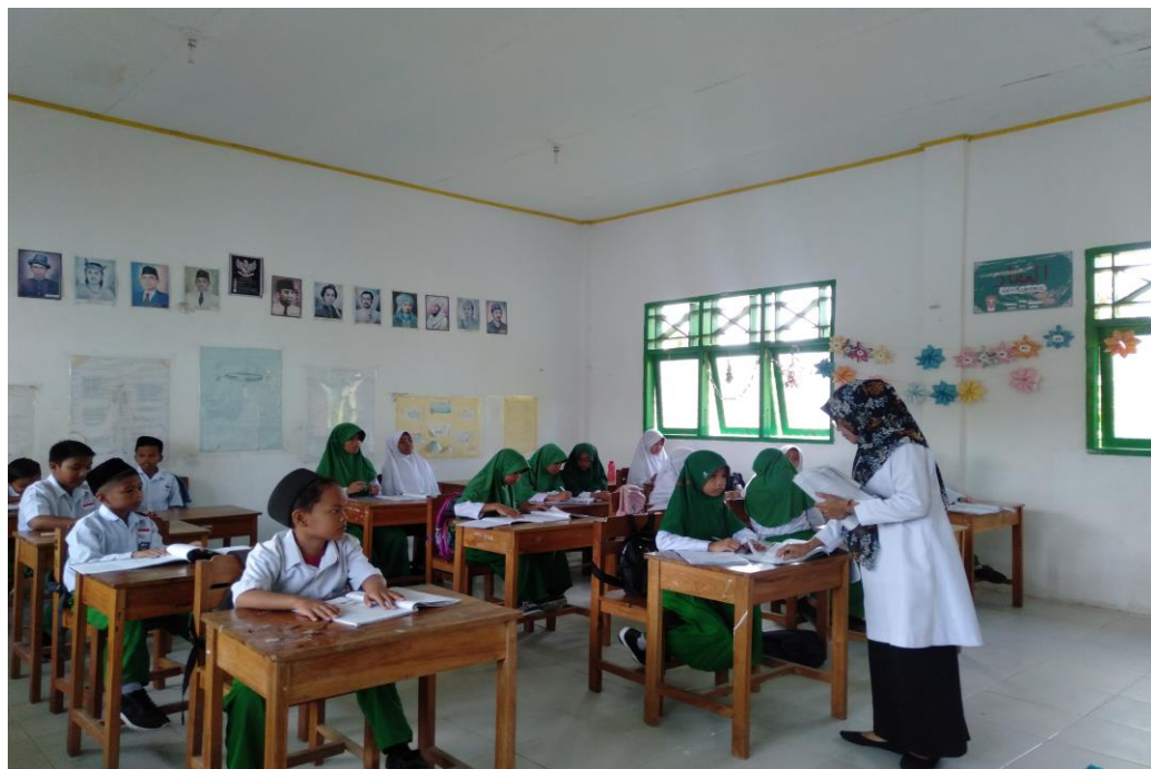
Gambar 8. Suasana kelas saat pembelajaran pada tanggal 1 November