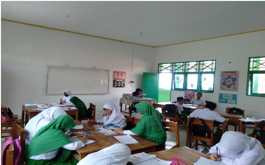
Gambar.9 suasana kelas saat pembelajaran pada tanggal 8 November