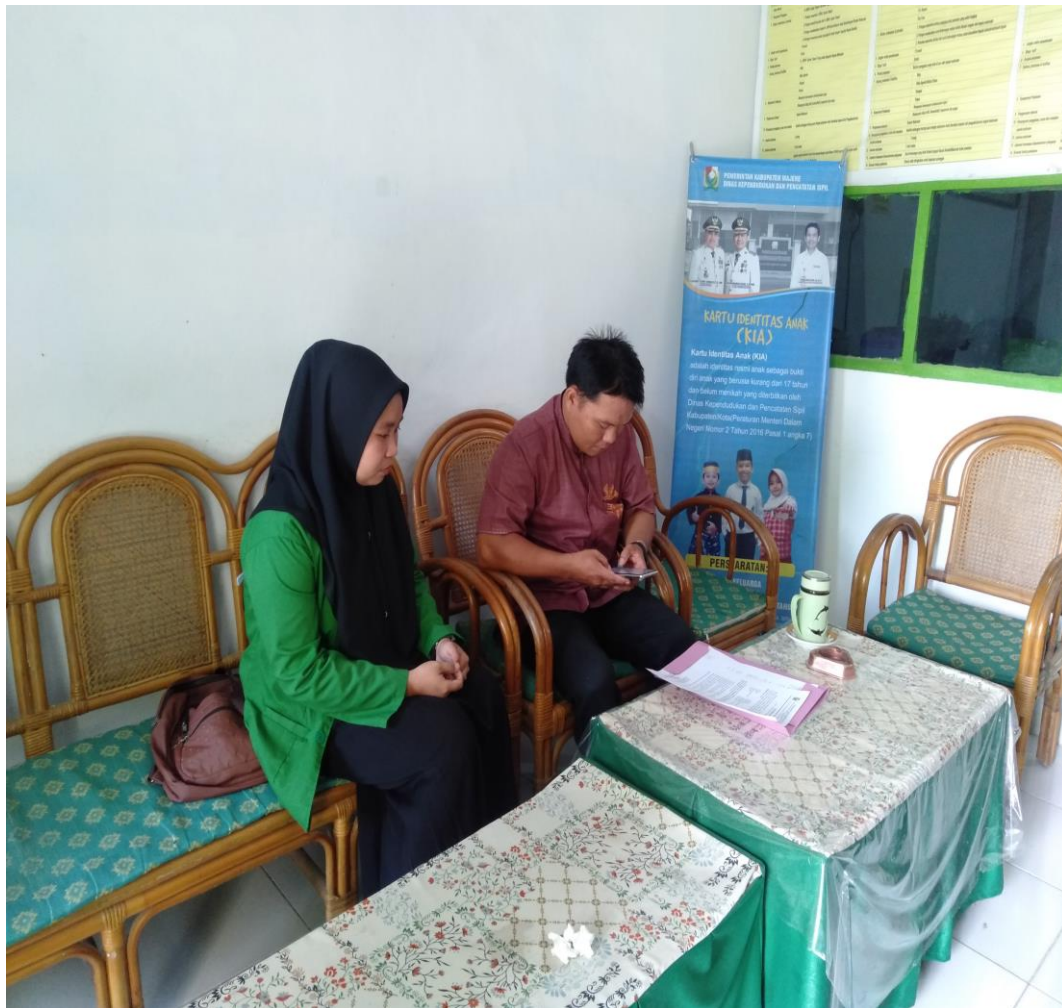
Gambar. 11 Dokumentasi Pengambilan Surat Izin Selesai Meneliti