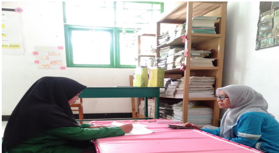
GAMBAR.1. Wawancara guru Akidah Akhlak terkait penerapan metode reward and punishment

Berdasarkan hasil penelitian yang diperoleh peneliti di MIN 1 Majene melalui Observasi, wawancara serta dokumentasi. Adapun Langkah- langkah penerapan metode reward and punishment