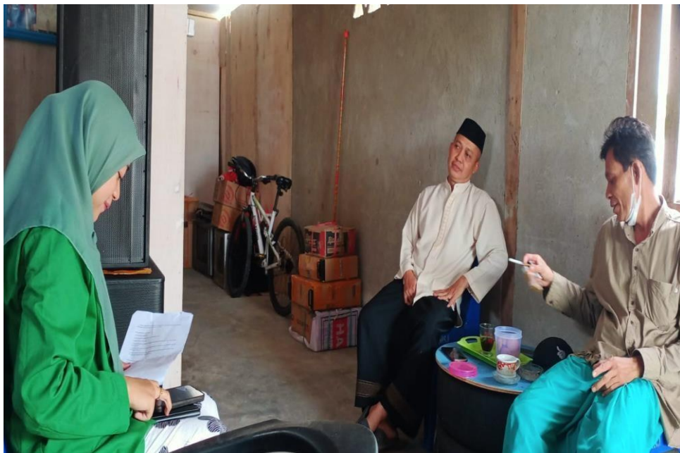
Wawancara dengan tokoh agama kelurahan kalukku