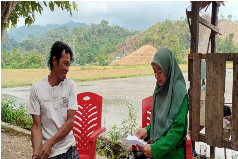
Wawancara dengan penerima gadai