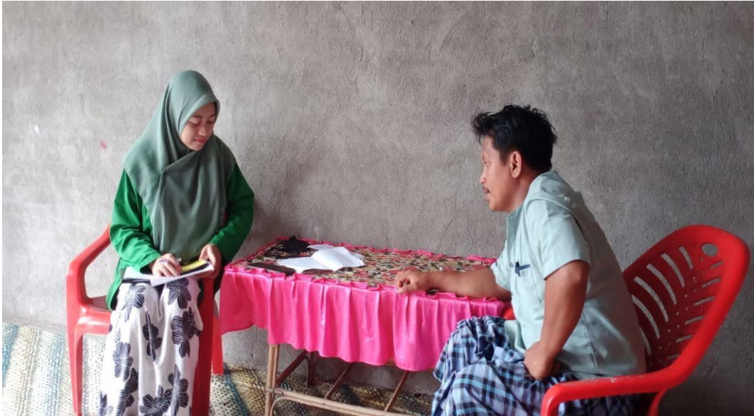
Wawancara dengan pemberi gadai