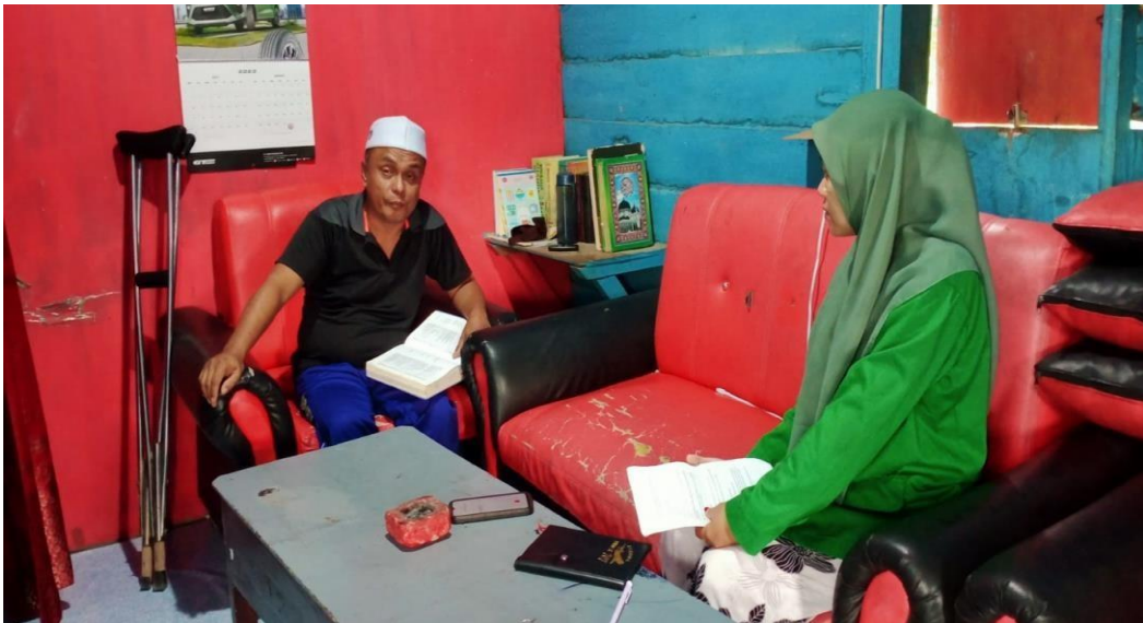
Wawancara dengan tokoh agama kelurahan kalukku