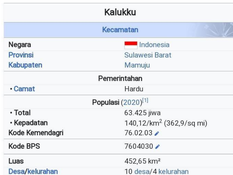
Gambar. 4.1 Profil Kelurahan Kalukku

Kalukku adalah sebuah kecamatan di Kabupaten Mamuju, provinsi Sulawesi Barat, Indonesia. Kecamatan ini terdiri dari 4 Kelurahan yaitu Kelurahan Bebunga, Pammulukang, Sinyonyoi, dan Kalukku, dan terdapat 10 Desa yaitu Desa Pammulukang, Kalukku Barat, Beru-Beru, Kabuloang, BelangBelang, Pokkang, Rea Guliling, Sondoang, Uhaimate dan Keang. Kecamatan Kalukku memiliki luas wilayah 452,65 km 2 dengan populasi ditahun 2020 berjumlah 63, 425 jiwa, dan kepadatan 140, 12 jiwa/km 2 , dan ibukota kecamatan terletak di kelurahan Kalukku.