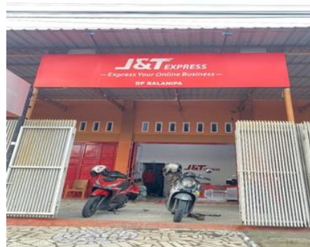
Gambar 1.1 Kantor J&T Express Balanipa