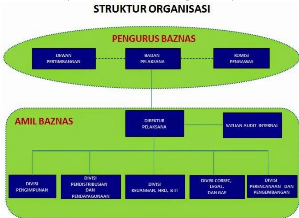
Gambar 2.1 struktur organisasi

Pengurus BAZNAS tetap berjumlah 17 orang yang terdiri ketua, wakil ketua 1, wakil ketua 2, unsur pelaksana, bidang pengumpulan, bidang perencanaan, pelaporan dan keuangan, bidang perindisribusian dan pendayagunaan, bidang administrasi, sumber daya manusia dan umum, satuan audit internal