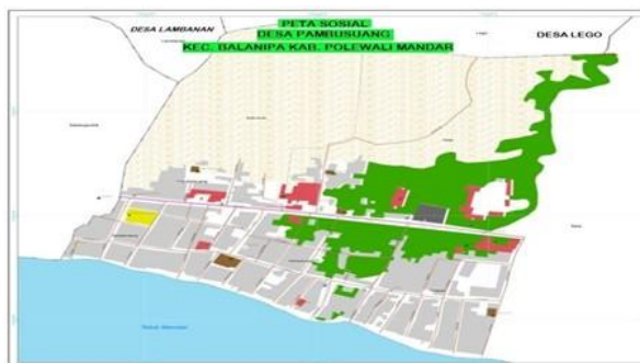
Gambar 1. Dena Desa Pambusuang

Desa Pambusuang memiliki iklim tidak jauh beda dengan kondisi iklim wilayah Kecamatan Balanipa. Desa Pambusuang secara umum dua musim, yaitu musim kemarau yang berlangsung antara bulan Juni hingga Agustus dan musim hujan antara bulan September hingga Mei dengan temperatur/suhu udara pada tahun 2009 rata-rata berkisar antara 29°C sampai 30°C dan suhu maksimum terjadi pada bulan Oktober dengan suhu 31°C serta suhu maksimum 28°C terjadi pada bulan Juni. Adapun dena lokasi Desa Pambusuang lebih jelasnya dapat dilihat pada gambar.