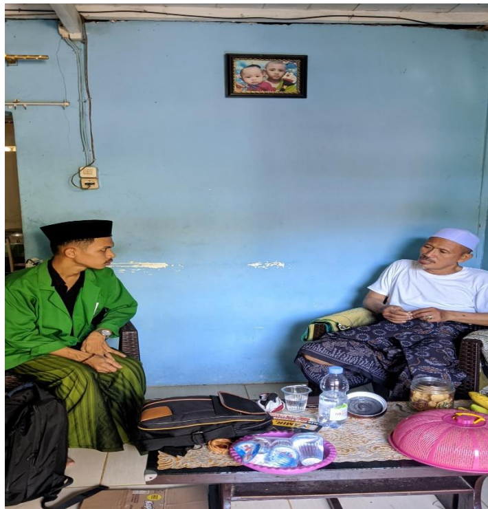
Ket. Wawancara dengan Ulama/ Annangguru di Desa Pambusuang