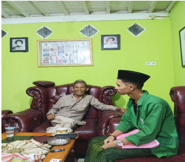
Ket. Wawancara dengan Ulama/ Annangguru di Desa Pambusuang