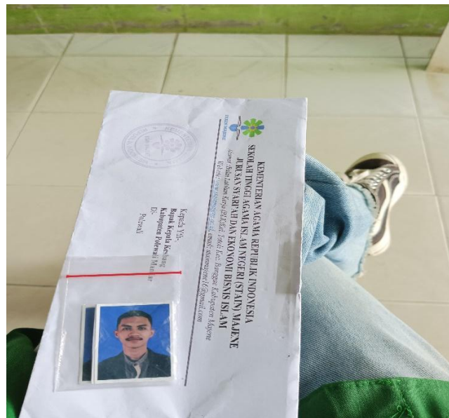
Memberikan surat izin meneliti kepada kepala kesbang Polewali Mandar