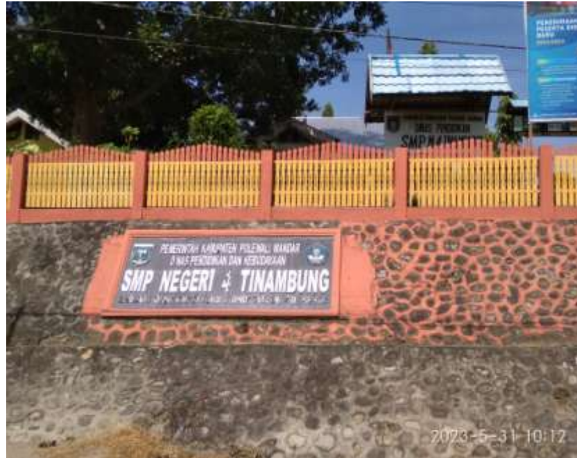
Gambar 1. SMP Negeri 4 Tinambung