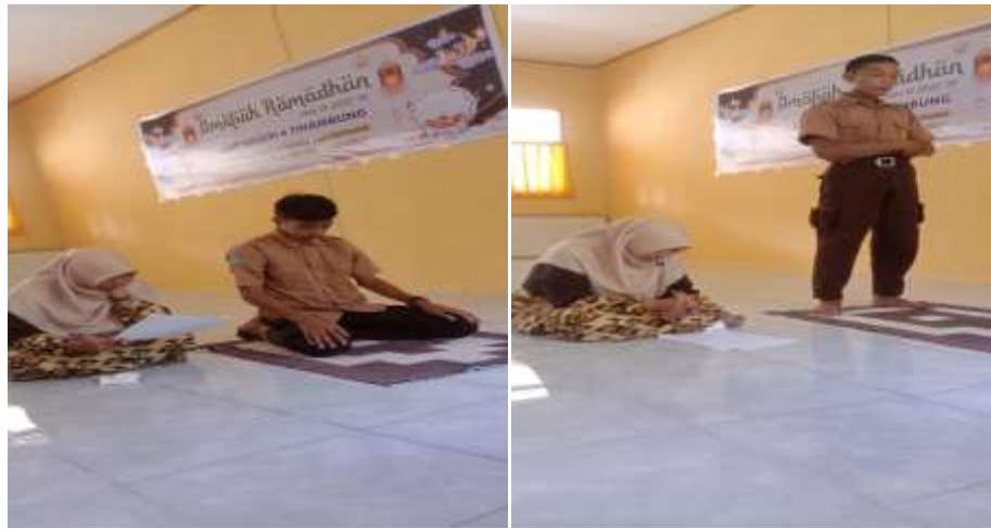
Gambar 9. Belajar Baca Al-Qur'an