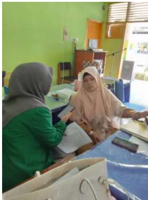
Wawancara dengan guru PAI SMP Negeri 1 Majene