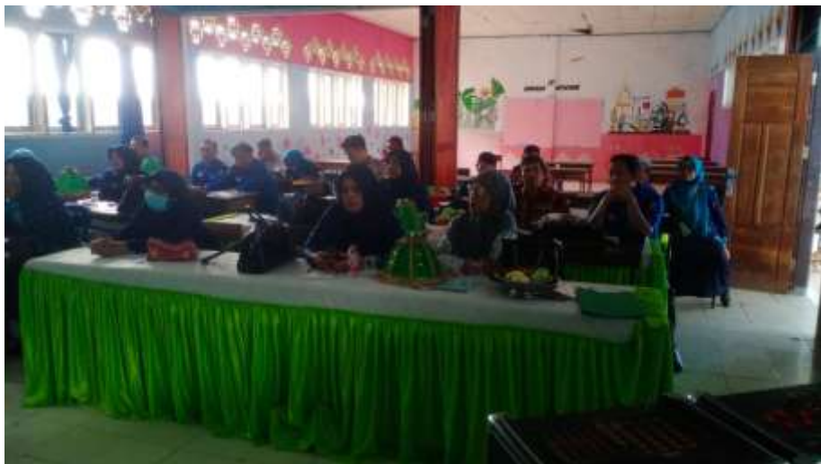
Pelaksanaan kegiatan Musyawarah Guru Mata Pelajaran (MGMP)