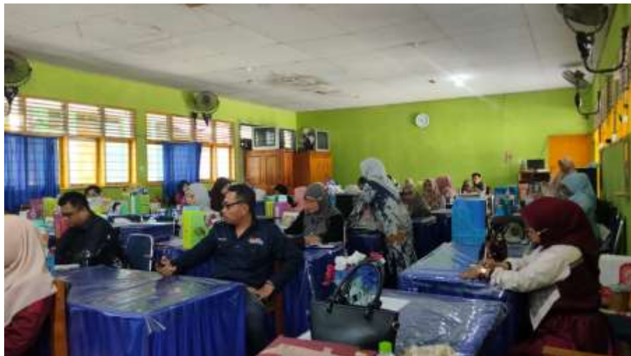
Observasi pelaksanaan rapat kerja guru SMP Negeri 1 Majene