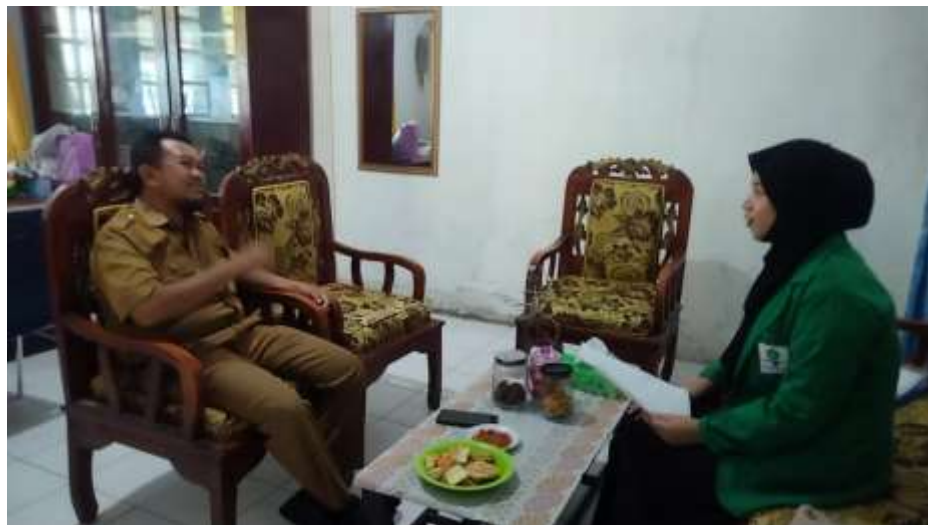
Wawancara dengan Kepala Sekolah SMP Negeri 1 Majene