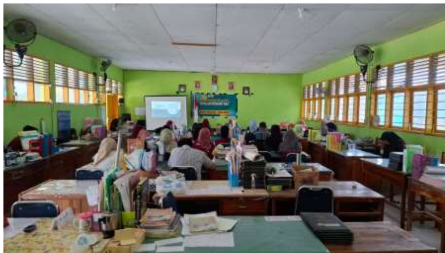
Observasi pelaksanaan Komunitas Belajar (KOMBEL) SMP Negeri 1 Majene