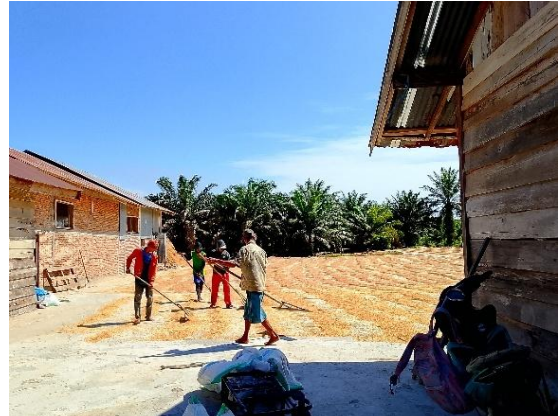
Gambar 1. 2 Proses Penjemuran Padi