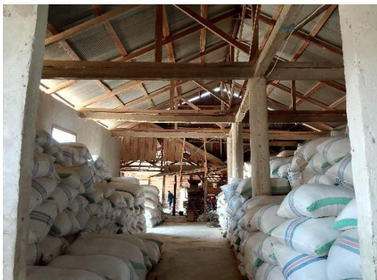
Gambar 1. 4 Gudang Padi