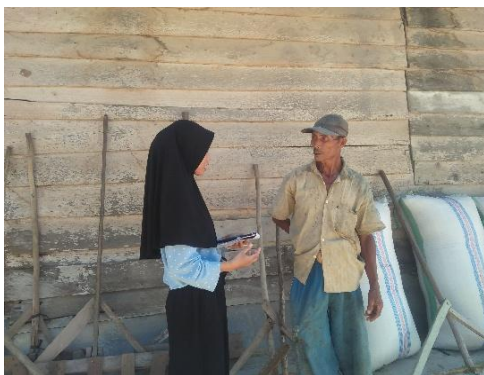
Gambar 1. 13 Karyawan Bagian Penjemuran (Bejo)