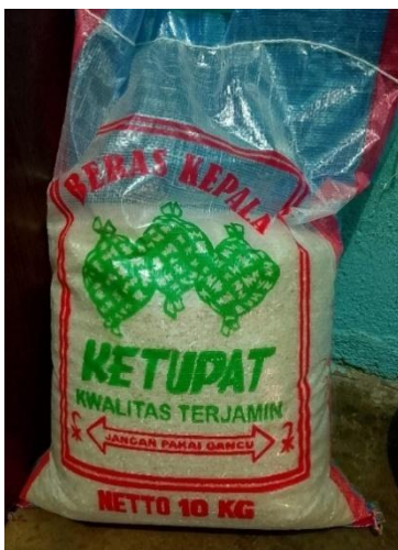
Gambar 1. 7 Sebelum di Timbang Cap Ketupat