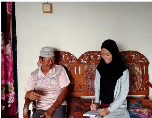
Gambar 1. 11 Karyawan Bagian Penjemuran (Wasrip)