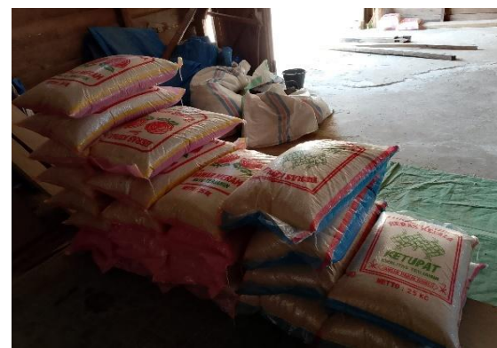
Gambar 1. 3 Merek Beras yang di Produksi