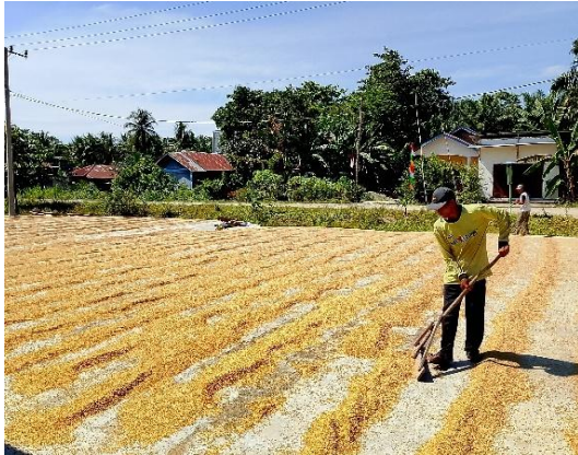
Gambar 1. 1 Proses Penjemuran Padi