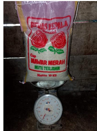
Gambar 1. 5 Kemasan lain Cap Mawar Merah