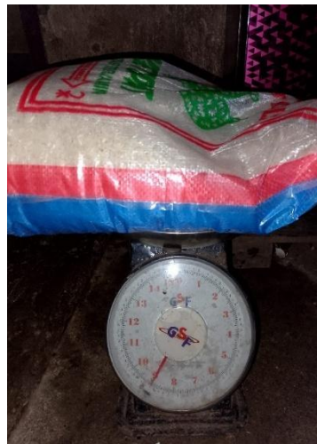
Gambar 1. 6 Setelah di Timbang Cap Ketupat