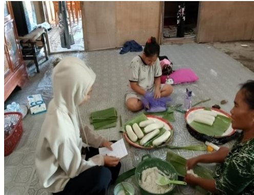
Gambar 1. 15 Distributor (Seneng)