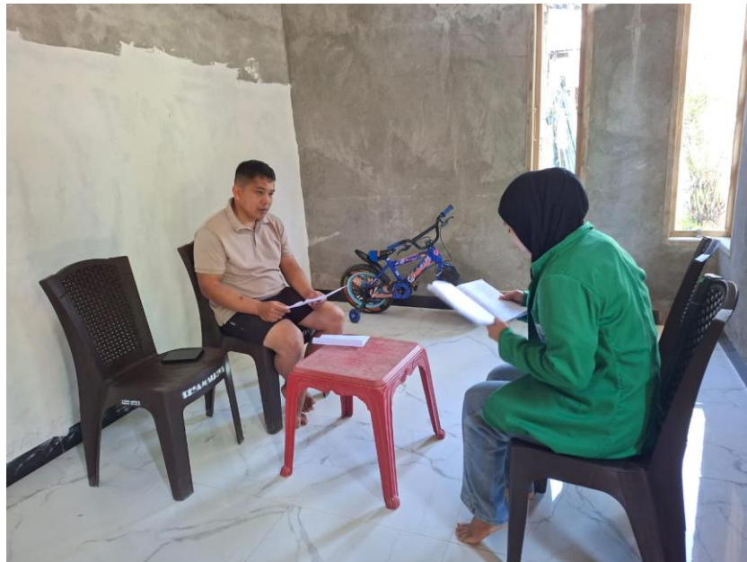
Gambar 1.6 Perempuan Single Parent