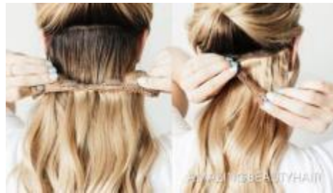
Gambar.1.4 metode hair clip

kerusakan besar dan cocok untuk penggunaan sementara, namun membutuhkan perawatan lebih dibandingkan metode lain agar tetap terlihat rapi dan alami.