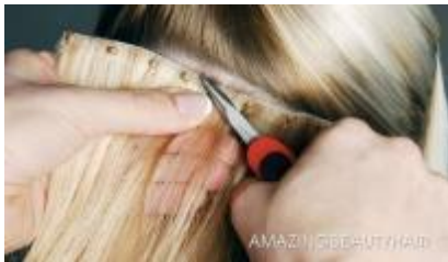
Metode Micro Bonds