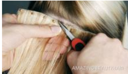
Gambar.1.2 metode micro bonds