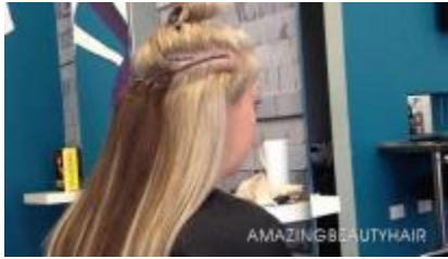
Metode Weaving / Tenun Rambut