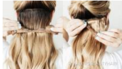
Metode Hair Clip