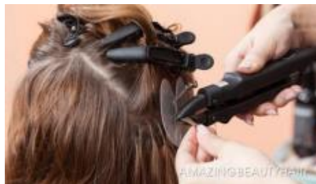
Gambar.1.3 metode fusion bonds