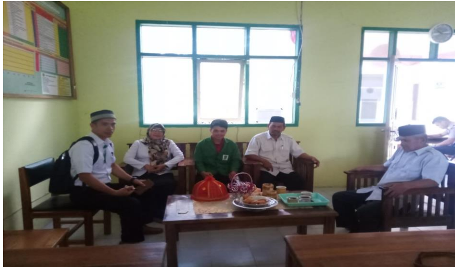
Gambar 1. Penyerahan surat izin penelitian dari DPM-PTSP Kab. Majene