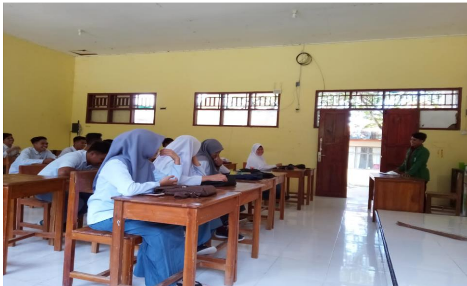
Gambar 2. Pembagian kuesioner kepada peserta didik MA DDI Banua Sendana