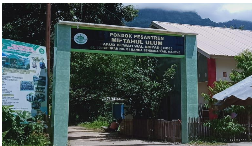
Gambar 5. Gerbang sekolah MA DDI Banua Sendana