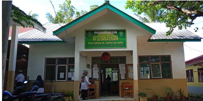
Gambar 3. Depan kantor Sekolah MA DDI Banua Sendana