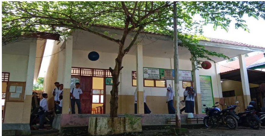
Gambar 4. Depan kelas XII MA DDI Banua Sendana