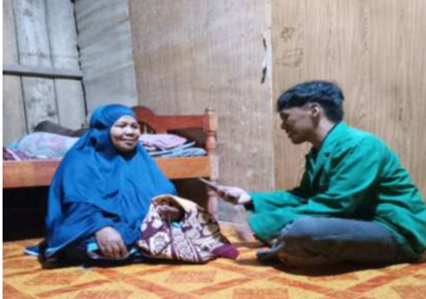
Gambar 5 wawancara dengan muztahik zakat