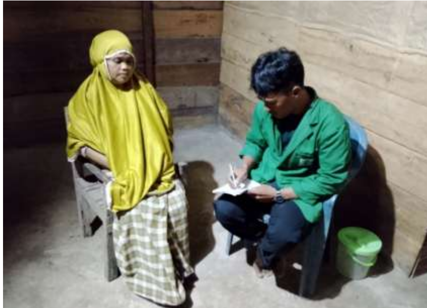
Gambar 9 Wawancara dengan muztahik zakat