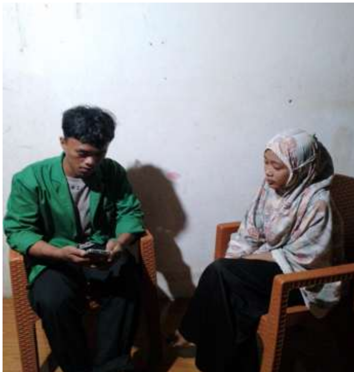
Gambar 7 wawancara dengan tokoh masyarakat