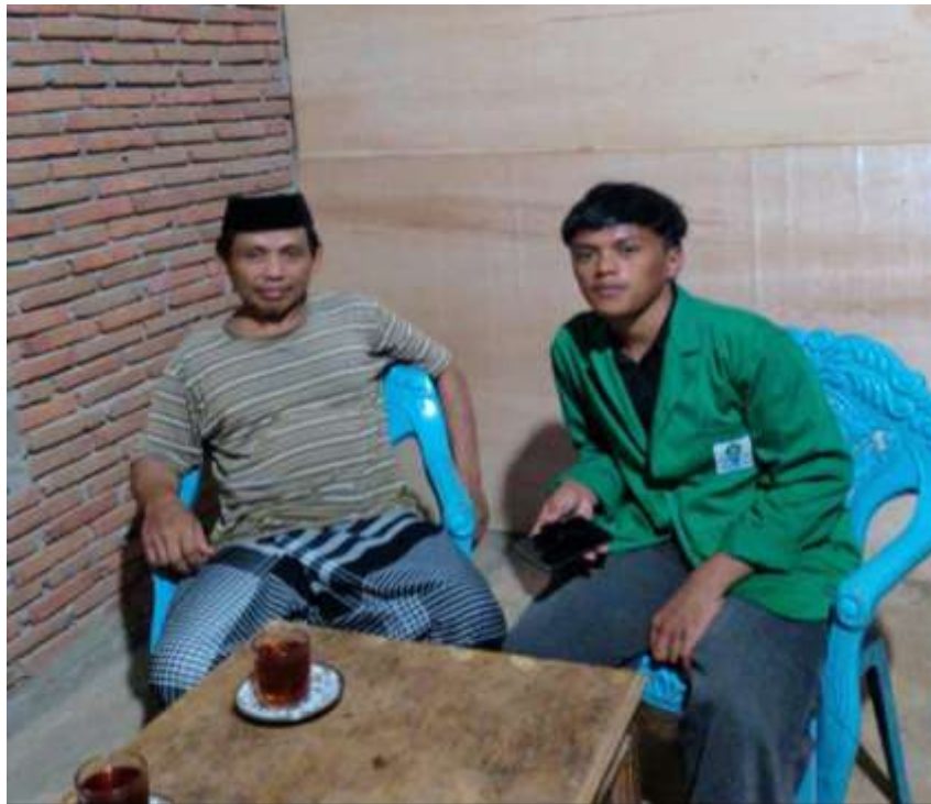
Gambar 11 wawancara dengan muztahik zakat