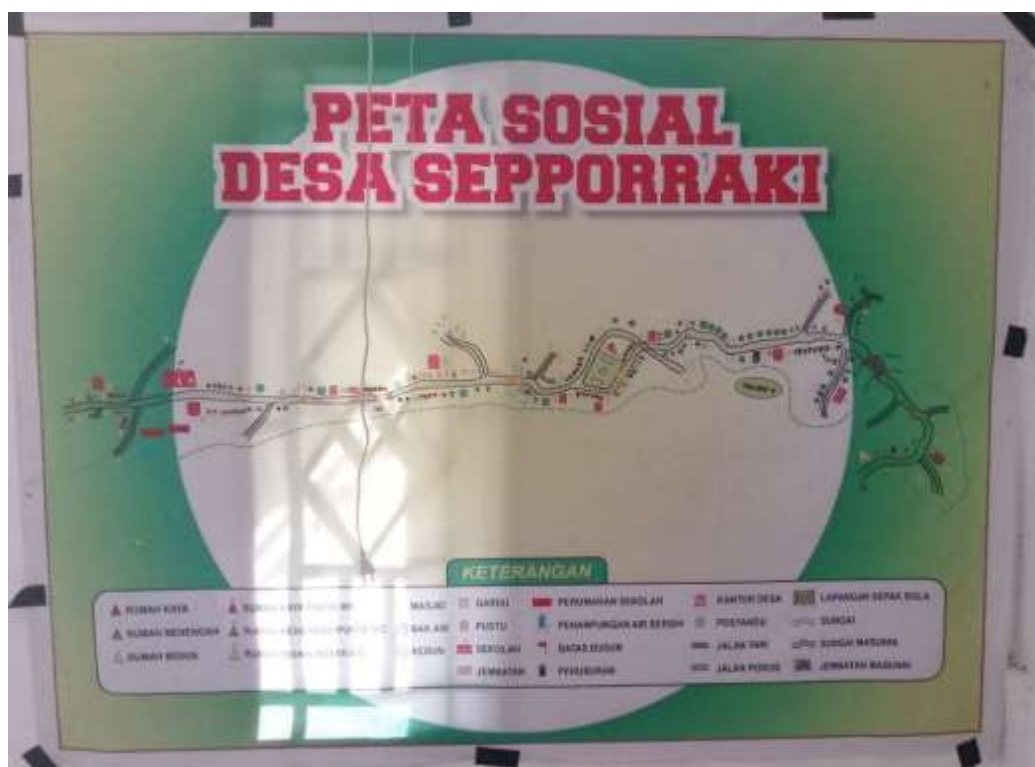
Gambar 1 peta Desa Sepporraki

Adapun jumlah penduduk di Desa Sepporraki sebagai berikut.