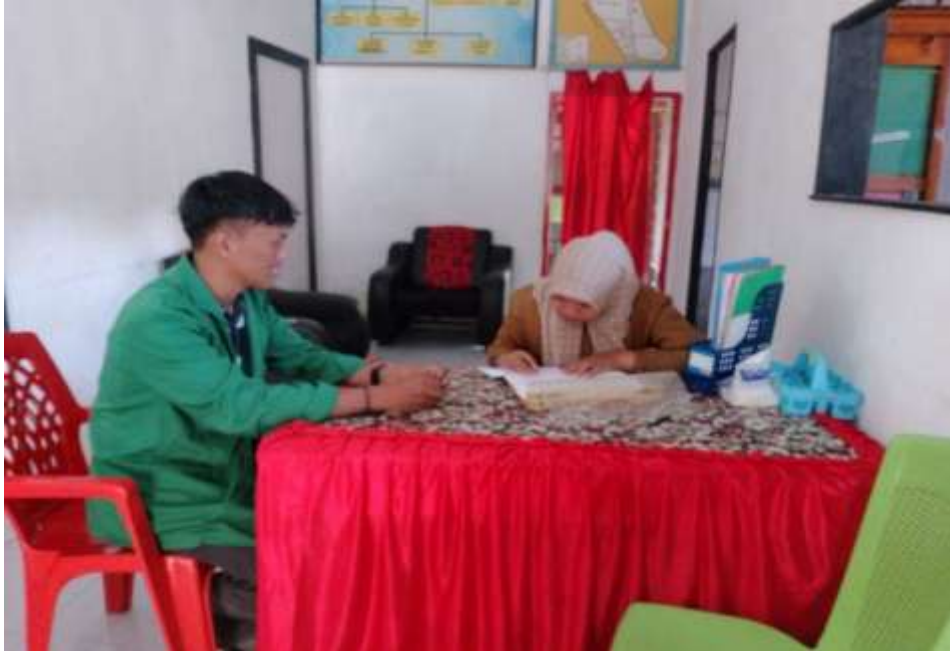
Gambar 13 wawancara dengan kepala KUA