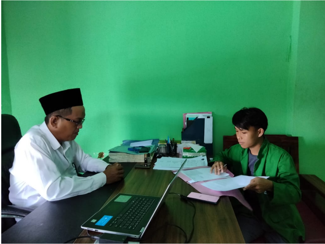
Foto wawancara Penyuluh Agama