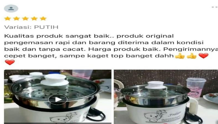
Gambar 2. Komentar Konsumen Flash Sale Shopee

Hasil penelitian dilakukan melalui pengumpulan data dari komentar-komentar pengguna pada aplikasi Shopee khususnya di kolom ulasan produk yang dijual dalam program flash sale . Hasilnya menunjukkan bahwa tanggapan pembeli terhadap diskon dalam flash sale sangat beragam mulai dari komentar yang sangat positif hingga keluhan dan ketidakpuasan. Sebagian besar komentar menunjukkan tanggapan yang positif dan antusias terhadap diskon besar yang ditawarkan. Para pengguna merasa sangat terbantu dengan adanya flash sale terutama karena mereka bisa mendapatkan produk impian dengan harga jauh lebih murah. Salah satu pembeli berkomentar: