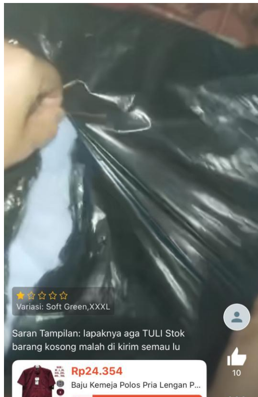
Gambar 5. Ulasan Pembeli Flash sale shopee

bentuk manipulasi ulasan dan rating produk. Praktik pembelian review positif palsu, penekanan terhadap ulasan negatif atau penciptaan akun fiktif untuk memberikan penilaian yang tidak objektif merupakan bentuk ketidakjujuran yang secara langsung merugikan konsumen. 29 Seperti contoh ulasan pembeli setelah mengikuti flash sale sebagai berikut: