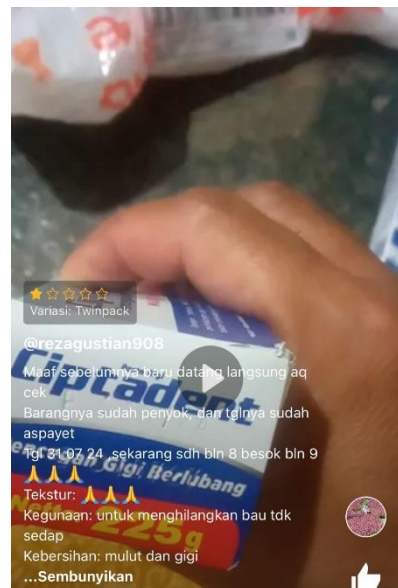
Gambar 4. Ulasan Pembeli Flash sale shopee

mendukung transparansi informasi yang diperlukan konsumen untuk membuat keputusan pembelian yang tepat namun demikian masih terdapat sejumlah aspek yang menimbulkan keraguan terhadap komitmen platform terhadap prinsip transparansi penuh. 21 Contohnya seperti ulasan konsumen berikut ini: