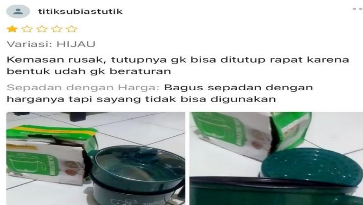
Gambar 3. Komentar Konsumen Flash Sale Shopee

Namun selain komentar yang mengarah pada hal positif, ada juga konsumen yang merasa produk flash sale mengecewakan dan tidak layak digunakan. Beberapa pengguna mengungkapkan bahwa meskipun harganya murah, produk yang diterima rusak, cacat, atau bahkan tidak berfungsi sama sekali. Salah satu pembeli berkomentar: