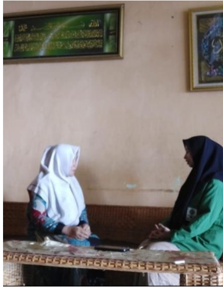
Gamber IX. Anggota Arisan