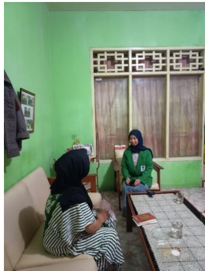
Gambar III. Anggota Arisan