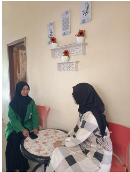
Gamber VII. Anggota Arisan