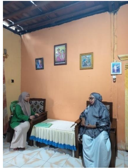
Gambar VIII Anggota Arisan