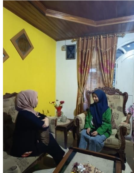
Gamber X Anggota Arisan