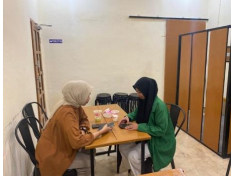
Gambar 1. Admin arisan